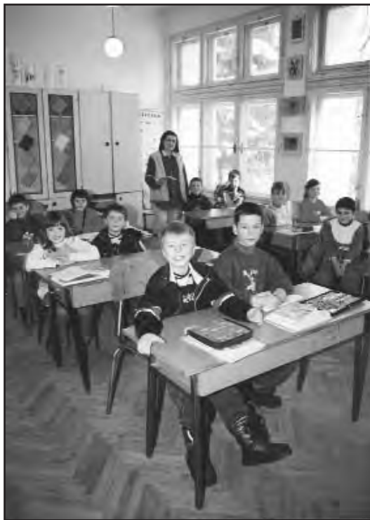
Nastava na hrvatskom u tavankutskoj školi

usvojenim u veljači prošle godine, Hrvatima u Vojvodini omogućeno je obrazovanje na materinskom jeziku. Zato i ovim putem pozivamo roditelje – građane hrvatske nacionalnosti, da svoju djecu upišu u odjelje-nja na hrvatskom jeziku« - rekli su somborski prosvjetni radnici.