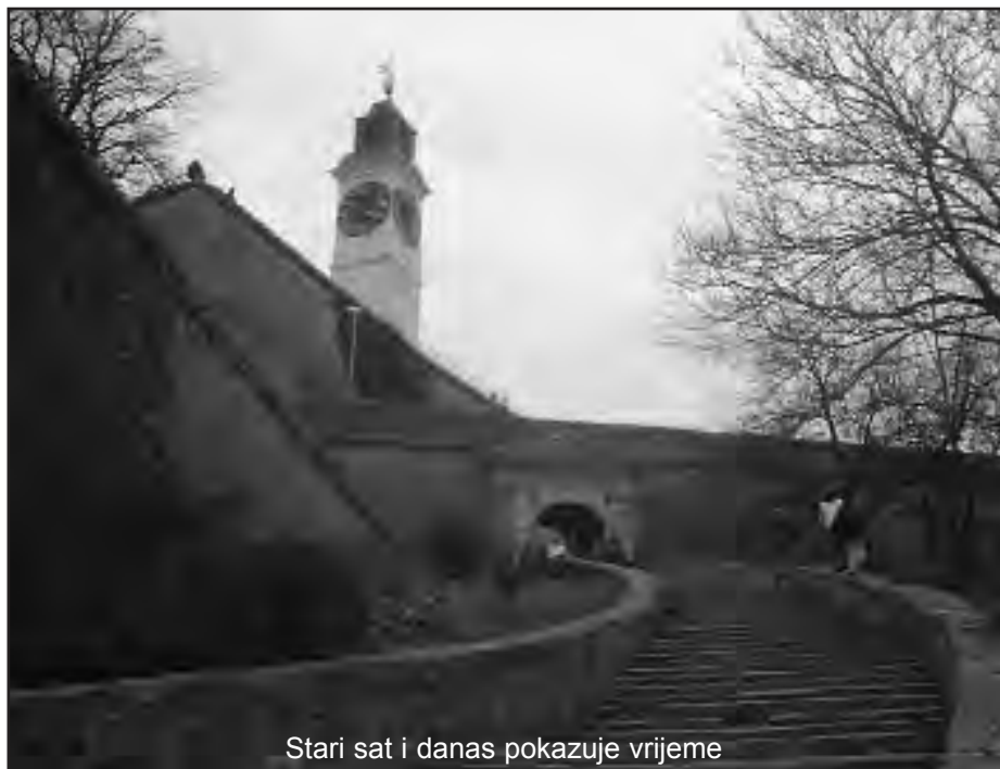
Stari sat i danas pokazuje vrijeme