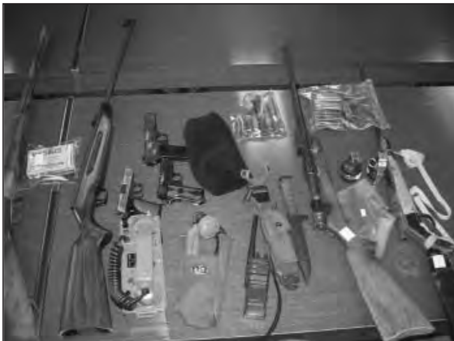
Dio zaplijenjenog arsenala: puške, pištolji, noževi i sredstva veze

Ono što je znakovito je, da su i Đorđe Srijemskoj Mitrovici, te da su praksu stekli u Novom Sadu, pa je predsjednik