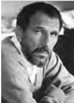
Piše: Ivan Torov, komentator Politike

Dok policija iz sve snage juri kriminalce raznih profila, Srbija živi u izvanrednim prilikama, sve sa nadom da one neće predugo trajati i da ćemo poslije njih biti čistiji, bar što se najkrupnijeg kriminala tiče. S druge strane, da ne znamo o čemu je riječ, da nije bilo podmuklog ubojstva predsjednika vlade, teško da bi itko i pomislio, da je ovdje na snazi izvanredno stanje.