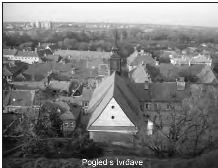
Pogled s tvrđave

Večernji je sat. Drugo zvono na crkvi Uznesenja Svetog Križa zvoni na molitvu Muke Isusove. Petrovaradinska biblioteka, smještena nedaleko od crkve, u staroj neadekvatnoj kući, pusta je. Mlada agilna knjižničarka žali što između dvije stotine članova tek nekoliko desetina aktivno čita i učestvuje u radu knjižnice. Iako je knjižnica grada Novog Sada, čiji je ovo ogranak, prepuna kompjutera, novih polica za knjige i namještaja, te se tu nađe i koja para viška za izdati i koju knjigu o srpskom nacionalnom pitanju, u petrovaradinskoj knjižnici stare police, stare knjige, stari stolci i nijedan kompjutor. U toj istoj knjižnici knjiga Miloša Lukića »Petrovaradin u prošlosti«, a u njoj piše da je u devetnaestom vijeku u Petrovaradinu radila Hrvatska knjižnica, osnovana 1869. godine u kući porodice Malin. »U razvijanju kulturnih aktivnosti, tad se u Petrovaradinu naročito isticao učitelj i pjesnik Jovan Hranilović, jugoslavenski orijentirano svećenstvo, odnosno onaj njegov dio koji je prihvatio ideje velikog hrvatskog prvosvećenika, biskupa đakovačkog, petrovaradinskog građanina i humaniste Josipa Juraja Štrossmajera.«