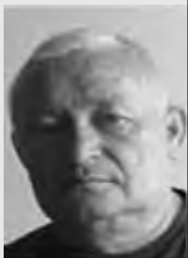
Piše: Srećko Mihailović, sociolog

Mladi ljudi u nesigurnom životu, sa malim ili smanjenim mogućnostima individualizacije, suočeni sa neizvjesnom budućnošću, prisilno produžavaju svoju mladost (usporen i veoma otežan ulazak u društvo punoljetnih i autonomnih ljudi) – okreću se i danas ka »MI-identitetima«.