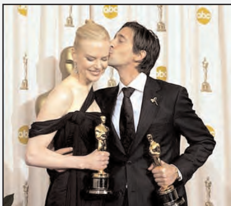
Dobitnici: Nicole Kidman i Adrien Brody

Da sve nije kao prije, govori i nedolazak mnogih nominiranih umjetnika, a i tradicionalni defile zvijezda na crvenom tepihu ispred glamurozne hale »Kodak Theatre« je izostao. Ceremonijal je počeo jednostavno i nimalo teatralno: Poznati komičar Steve Martin izašao je na binu i uvodnim govorom duhovito prokomentirao nominirane filmove, (ne)dolazak filmađžija, rat koji tutnji i – fešta je počela. Redali su se, tako, prezenteri i dodjeljivači nagrada, sa dobitnicima, uplakanim po običaju, potresenim i vrlo dirnutim. O svojim stavovima glede rata, dobitnicima je preporučeno da se ne izjašnjavaju, mada, ipak, o umjetnicima je riječ, mnogi su, suptilno ili ne, spomenuli rat. Prvi je hrabrost skupio Michael Moor , dobitnik nagrade za najbolji dokumentarni film »Bowling for Columbine« o fascinaciji Amerikanaca spram oružja i baruta, vrlo jasno i bučno rekavši: »Ovo je fiktivna zemlja sa fiktivnim predsjednikom koji je lažirao izbore, i koji vodi fiktivni rat u kome ginu realni ljudi. Srami se George Bush , srami se!