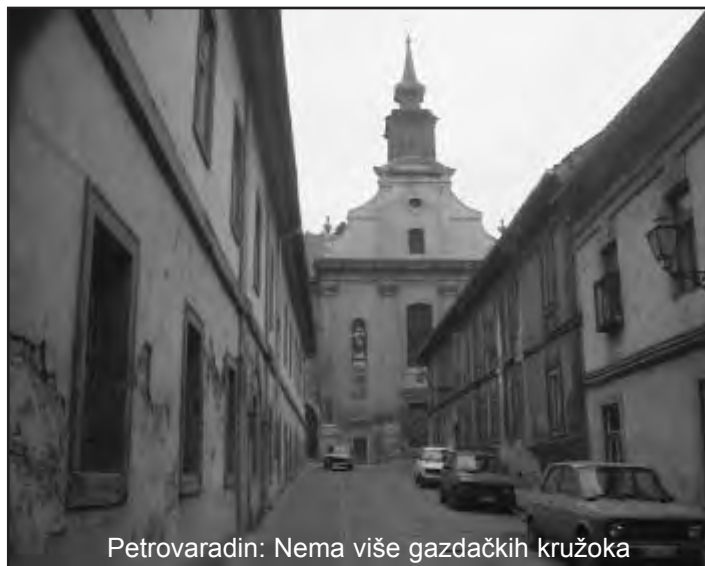
Petrovaradin: Nema više gazdačkih kružoka

KAFKINI RODACI: Da li zbog položaja naspram Tvrđave, koji podsjeća na Kafkin »Zamak«, Petrovaradin se danas, na početku XXI vijeka, nalazi u kafkijanskoj situaciji. Naime, 2000. godine po odredbama Zakona o lokalnoj samoupravi Skupština općine Novi Sad Petrovaradinu je vratila status općine, koji