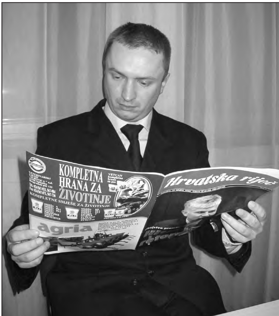
U redakciji »Hrvatske riječi«

nom nisu uspjeli. Kad god su pokušavali glasovati protiv nekih zakona, da izlobiraju oporbu da glasa protiv, doživjeli su neuspjeh. To je po njih u stvari bilo traumatično. Posljednji puta, prilikom izbora premijera, pokušali su izlobirati zastupnike SPS kako ne bi bilo kvoruma. Ti su poslanici, međutim, rekli: Pa, nije šef našeg zastupničkog kluba Dejan Mihajlov, nego Obradović. U tom smislu, DSS je sebe neprestano dovodio u jednu blamantnu poziciju izigravanja veće oporbe nego što su to radikalni i socijalisti. Posljednja sjednica je to jasno pokazala. Naime, jedino su zastupnici Mihajlov i Maršićanin ne samo bez pijeteta negi i dosta ironično, čak na trenutke podsmješljivo, komentirali situaciju i okolnosti vezane za atentat na