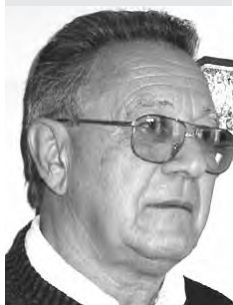
Piše: Alojzije Stantić

Naši stari su kadgod krv vaćali šiljerom il kadarkom, a kad njeg nije bilo pri ruki, pili su onda omiljenu kevidinku, a u novije vrime rizling il bilo koje bilo vino. Važno je da je vino dobro, mora bit i razlađeno, onda dobro sklizne niz gegu, a u odabranom društvu padne još bolje.