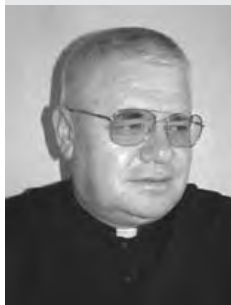
Piše: Vič. mr. Andrija Kopilović

Rat je. Jednako tako smo još uvijek pod doj- mom jednog prekinutog živ- otnog puta, koji nas je ražalostio i začas zaus- tavio, da bismo sa puno više muke sada tre- bali otvoriti nove putove nade i nastaviti tamo gdje je put prekinut.