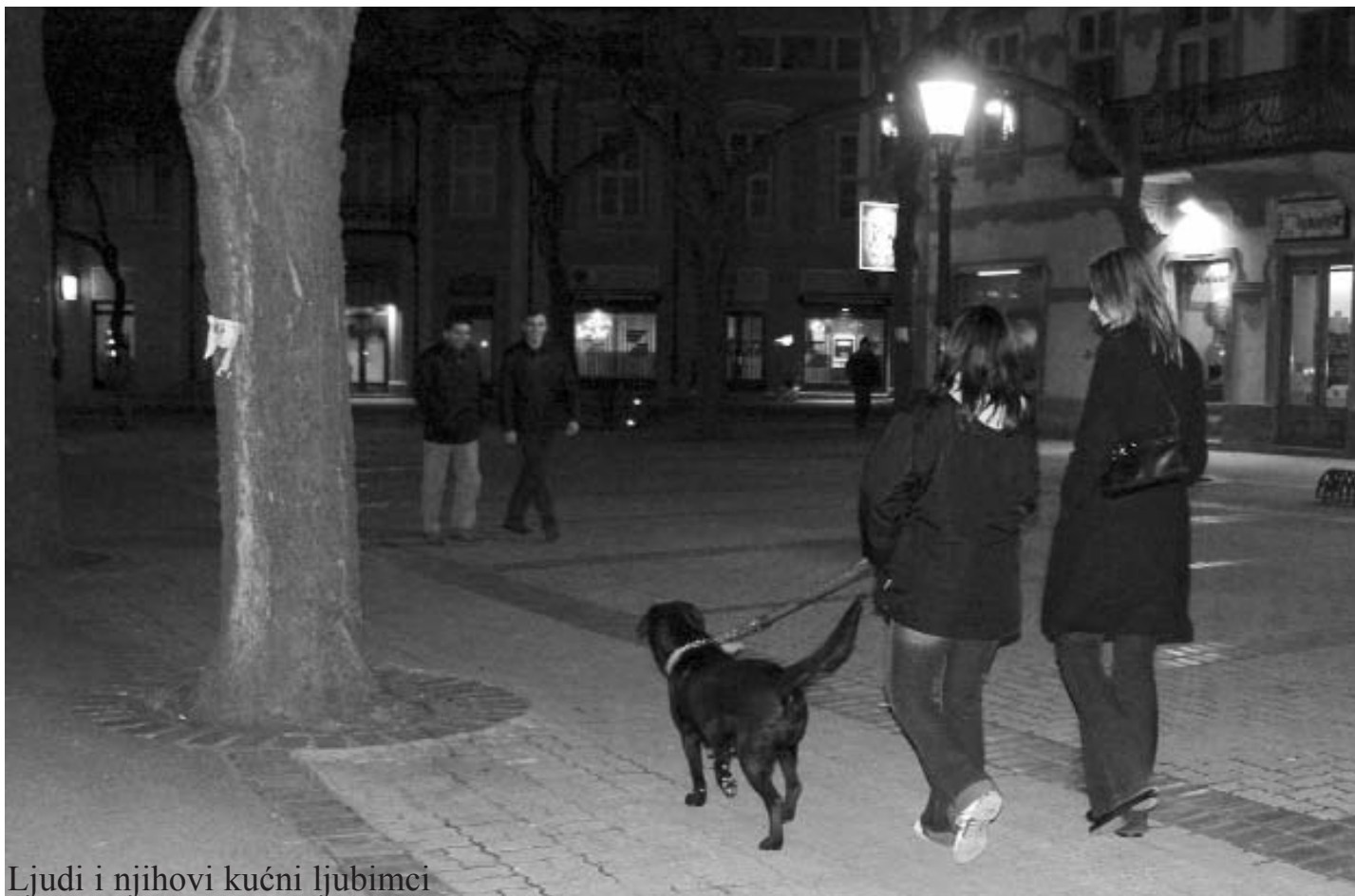
Ljudi i njihovi kućni ljubimci