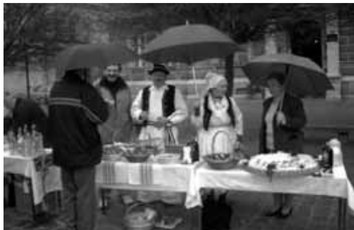
Šokci su prodavali rakiju i vino, a Šokice šarana jaja i kolače

PUNE RUKE POSLA: I ove je godine prosudbena komisija imala pune ruke posla i teška je srca odlučila koji su od postavljenih štandova najljepši, jer svaki je bio lijep na svoj način. Ipak, prvo je mjesto pripalo Udruzi »Šokačka grana«, drugo Matici slo-