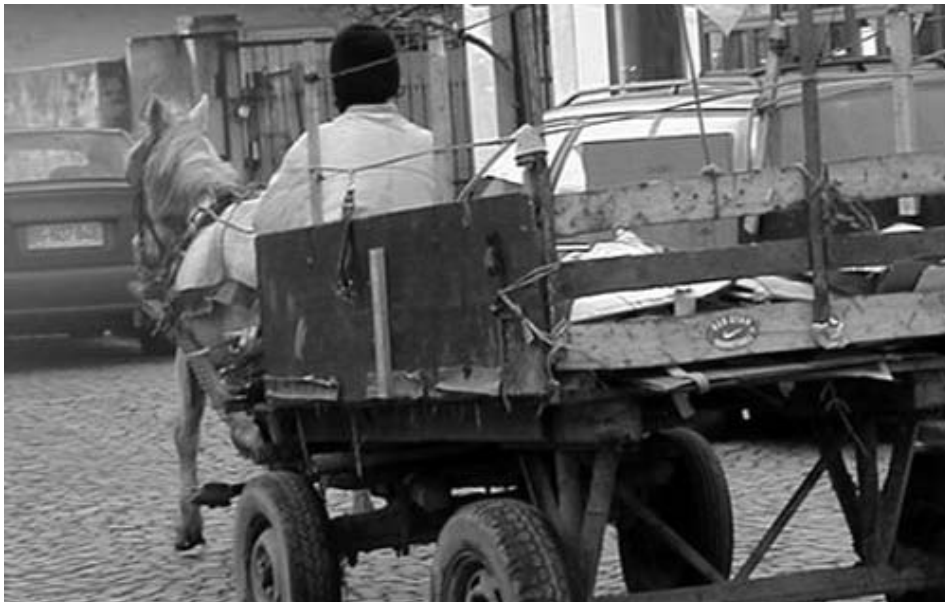
Nitko ne bira hoće li se roditi s crnom ili bijelom kožom, ovakvim ili onakvim imenom, siromašan ili bogat

očuvanje njihovog identiteta, a naročito imaju pravo slobode izbora i upotrebe osobnog imena i imena djece i upisivanja tih imena u sve javne isprave i prema jeziku i pravopisu pripadnika manjine. Zakonom se omogućuje sloboda privatne i javne uporabe materinjeg jezika, te pravo na