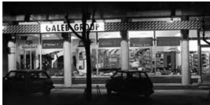
Beogradska ulica: mjesto masovne tuče