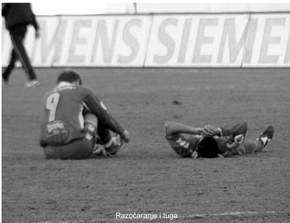
Razočaranje i tuga

LIGA ZA OSTANAK: Iako je prema plasmanu na tablici »dopao« u natjecanje za ostanak u prvoligaškom društvu, zagrebački Dinamo ne mora brinuti o svom mjestu u hrvatskom elitnom nogometnom raz-