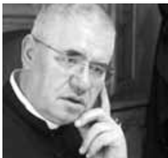
Piše: vlč. dr. Andrija Kopilović