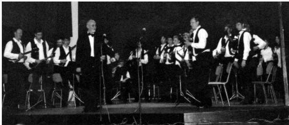
Veliki tamburaški orkestar