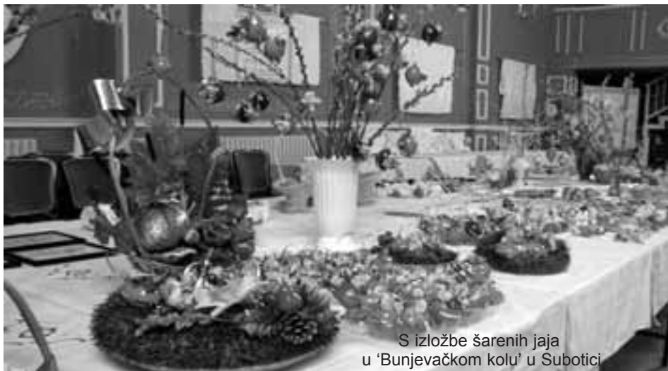
S izložbe šarenih jaja u 'Bunjevačkom kolu' u Subotici

Stari Egipćani su virovali da je svit posto tako da je visok brig izronio iz vode, a na njegovom je vrvu bilo veliko jaje iz kojeg je posto svit. Od pamtivika su ljudi kadgod jaje štovali ko izvor života, da je u njem nasto život, možda već i zato jel najveći dio živine (životinja) na svit dolazi iz jaje -