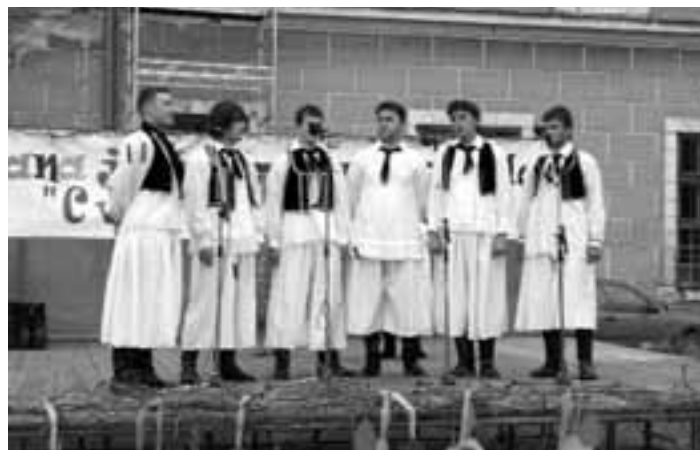
Muška pjevačka skupina iz Topolja