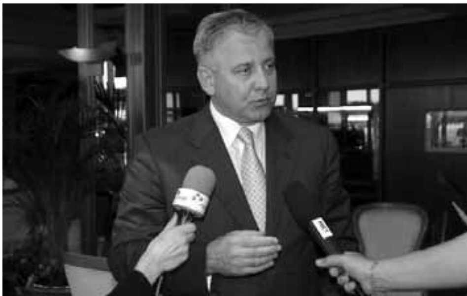
Odgoda je manja stanka u procesu približavanja Hrvatske EU: premijer Ivo Sanader

CARLINA ZADNJA: Tijekom prošle godine i početkom ove hrvatska Vlada je, uz činjenicu da nije uspjela locirati i uhititi odbjeglog generala Antu Gotovinu, povukla više poteza zbog kojih glavna haška tužiteljica Carla del Ponte ocjenjuje da Hrvatska ne surađuje u potpunosti s haškim Tužiteljstvom. Jedna od glavnih njezinih