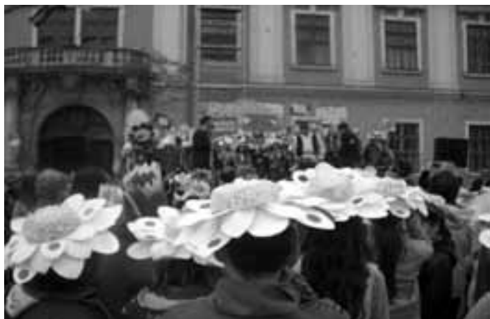
Cvjetni korzo: djeca su najljepši vjesnici proljeća

UDRUGE NA TRGU: Svojim su štandovima, rukotvorinama i spregršt maštovitih ideja osječki Trg Sv. Trojstva украсili članovi udruga: Centar »Ivan Štark«, Centar za predškolski odgoj, Centar za profesionalnu rehabilitaciju, Društvo »Naša djeca«, Mađarsko kulturno društvo »Nepkör«, Makedonsko kulturno društvo »Braća Miladinovci«, Matica slovačka, Kulturno-prosvjetno društvo Rusina i Ukrajinaca, Udruga »Šokačka grana«, Udruga »Radosno polje«, Udruga prijatelja baranjskih starina »Ižip« Topolje, Udruga za rad s mladima »Breza«, Udruga žena »Klas« Bečetinci, Udruga »Tuljan«, Srpsko kulturno društvo »Prosvjeta«, Zavičajna udruga Gibarac i Zemaljska udruga Podunavskih Švaba.