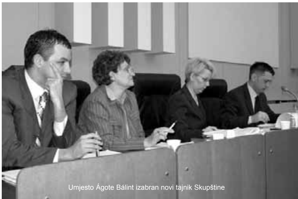
Umjesto Ágote Bálint izabran novi tajnik Skupštine