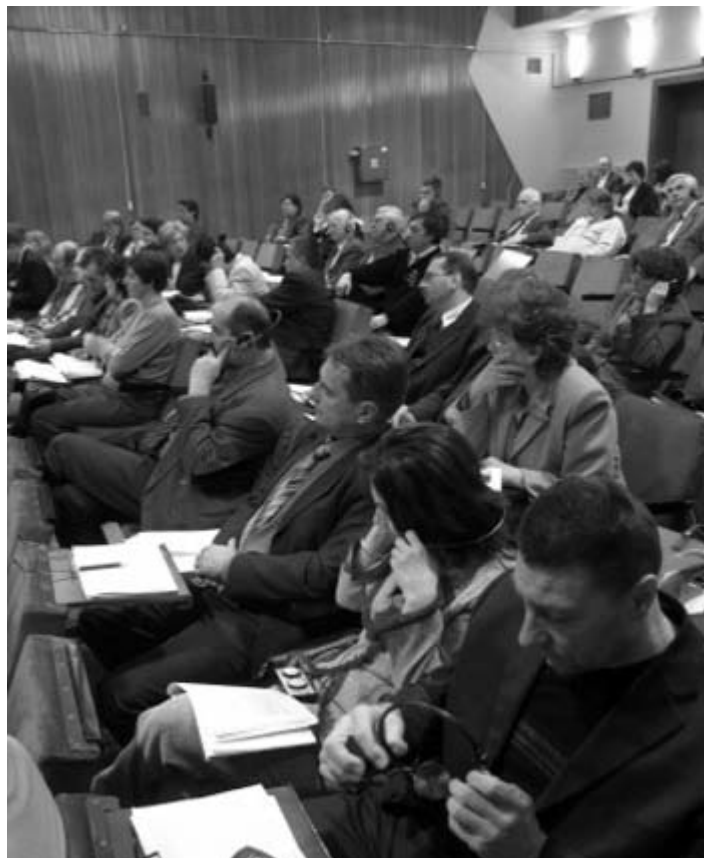
Etički kodeks za dužnosnike: sa sjednice SO

Usvojen je Etički kodeks ponašanja dužnosnika lokalne samo-