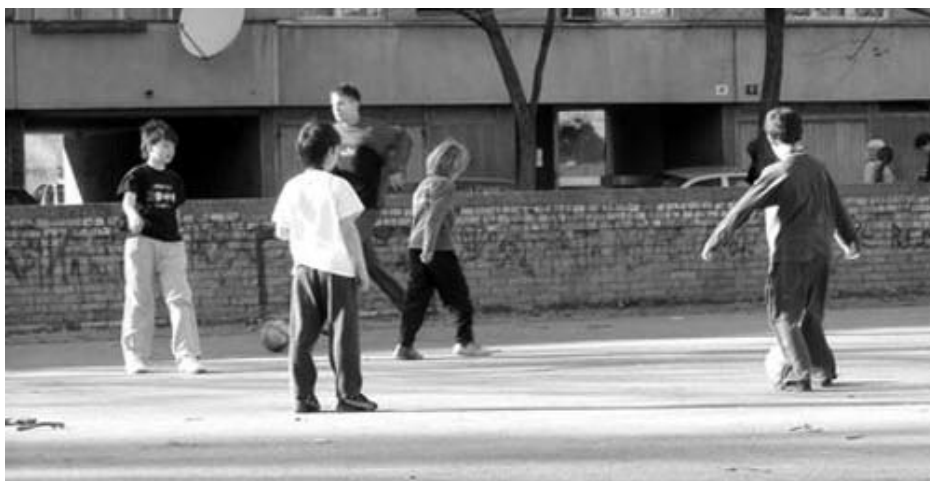
U svijetu ima dovoljno mjesta za sve

načelo jednake zaštite maloljetnika, jednakost u obrazovnom procesu ili stručnom osposobljavanju, manjinama ili njihovim pripadnicama ukine ili ograniči posebna prava koja imaju za cilj očuvanje njihovog identiteta, ili pak povrijedi zabranu diskriminacije zbog izražavanja političkih uvjerenja, te postupka suprotno zabrani diskriminacije invalida i tako dalje. Pokraj novčanih kazni koje su obvezne, zakonom se predviđaju i disciplinske mjere i to u slučajevima ako su uslijed diskriminacijskog postupanja nastupile naročito teške posljedice, kao što su diskriminacija većeg broja osoba ili uzrokovanje velike materijalne štete može se izreći zabrana vršenja određenih poslova odgovornoj osobi u trajanju od tri mjeseca do jedne godine ili se može zabraniti poslodavcu ili drugoj fizičkoj osobi koja obavlja neku djelatnost ili pruža uslugu, da vrši tu djelatnost u trajanju od tri mjeseca do jedne godine. Također, za prekršaj diskriminiranja osoba i diskriminacijskog ponašanja, prekršitelj će morati dovesti u prethodno stanje objekt na kome su diskriminacijski simboli ispisani ili istaknuti, a može mu se izreći mjera zabrane sudjelovanja u tijelima koja odlučuju o zasnivanju radnog odnosa za vrijeme od tri mjeseca do jedne godine. Prekršitelju se također može zabraniti da se približi radnom ili drugom javnom mjestu gdje je diskriminirana osoba za vrijeme od tri mjeseca do jedne godine.