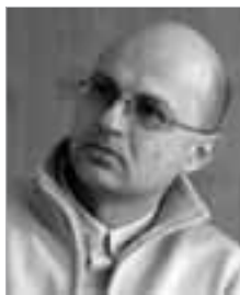
Piše: Slaven Bačić