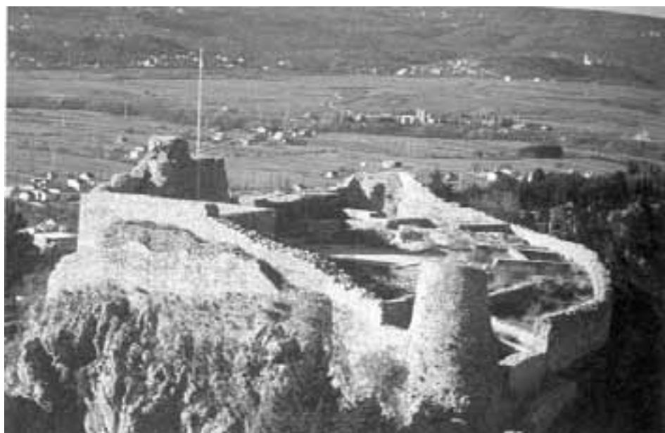
Osmanlijsku utvrd u Imotskom mletačka je vojska zauzela 1717. godine

Franjo Trenk je lovio odmetnike u slavonskim šumama i uhićenicima ponudio alternativu: pogubljenje ili služba u vojsci. Vojnicima je plaću dao unaprijed, obukao ih u odoru sličnu osmanlijskim janjičarima (ostali su se habsburški vojnici sami opremali za rat), a momčad je u boju pratila glazba. Hrabrošću ali i surovošću na bojnopolju ulili su strah neprijateljskim vojnicima – protivnici su mislili da ih napada osmanlijska vojska.