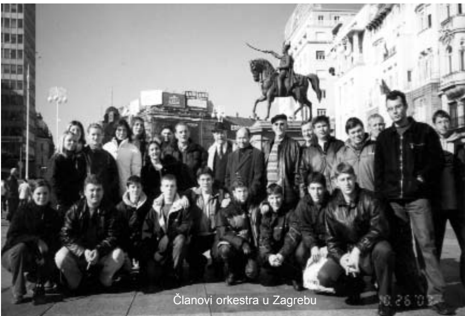
Članovi orkestra u Zagrebu