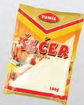
Šećer u prahu 100g