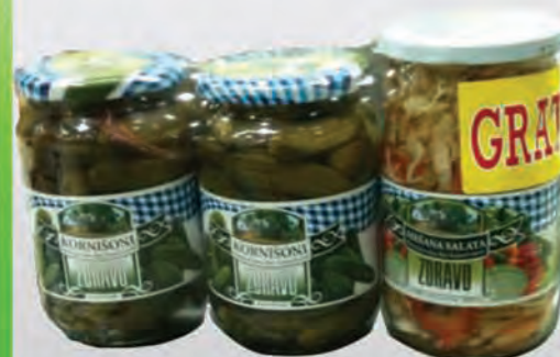
Kornišoni 2 x 670g +miješana salata GRATIS