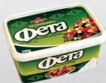
Sir Leskovački feta 500g