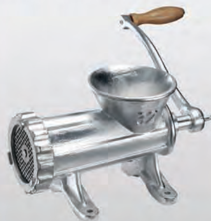
Mašina za mljevenje mesa