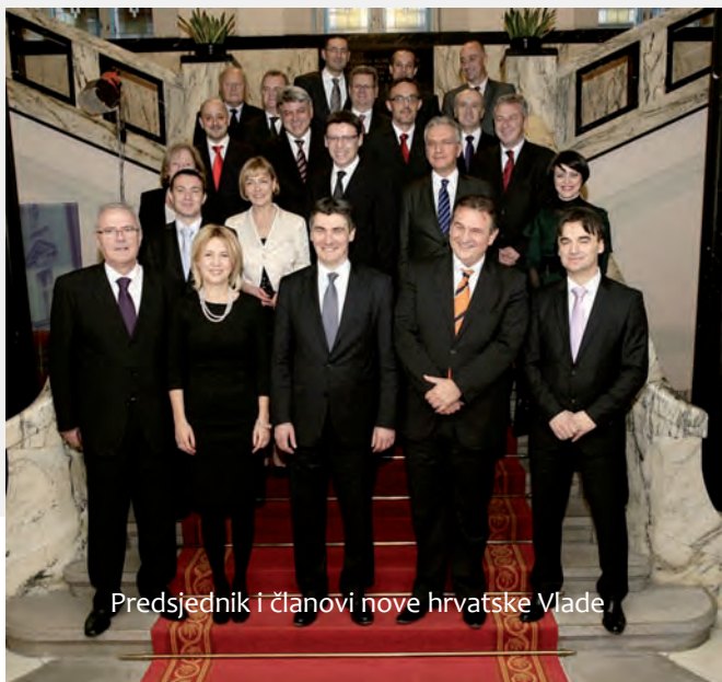
Predsjednik i članovi nove hrvatske Vlade

Predsjednik nove Vlade RH je Zoran Milanović , čelnik SDP-a, a prvi potpredsjednik Vlade je čelnik HNS-a Radimir Čačić , koji će obnašati i dužnost ministra gospodarstva. SDP ima troje potpredsjednika Vlade – Milanku Opačić , koja je i ministrica socijalne politike i mladih, Branka Grčića , koji će voditi i ministarstvo regionalnog razvoja i fondova EU, te Nevena Mimicu kao potpredsjednika vlade za unutarnju, vanjsku i europsku politiku. Vesna Pusić (HNS) dobila je povjerenje Sabora kao ministrica vanjskih i europskih poslova, ministar unutarnjih poslova je Ranko Ostojić (SDP), zdravlja Rajko Ostojić (SDP), financija Slavko Linić (SDP), obrane Ante Kotromanović (SDP), pravosuđa Orsat Miljenić (nestranački), uprave Arsen Bauk (SDP), poduzetništva i obrta Gordan Maras (SDP). Ministar rada i mirovinskog sustava postao je Mirando Mrsić (SDP), pomorstva, prometa i infrastrukture Zlatko Komadina (SDP), poljoprivrede Tihomir Jakovina (SDP), turizma Veljko Ostojić (IDS), kulture Andrea Zlatar (HNS), zaštite okoliša i prirode Mirela Holy (SDP), graditeljstva i prostornog uređenja Ivan Vrdoljak (HNS), branitelja Predrag Matić (nestranački) te znatnosti, obrazovanja i sporta Željko Jovanović (SDP).