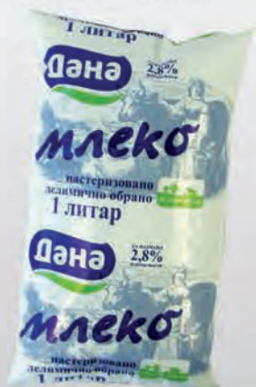
Mlijeko sveže 1L 2.8 % mliječne masti