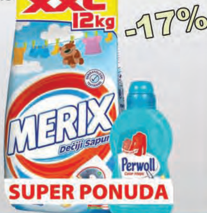
Deterdžent za rublje Merix Dječiji sapun 12kg + Perwoll Color 1l Gratis