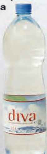
Voda Diva 1,5 L negazirana