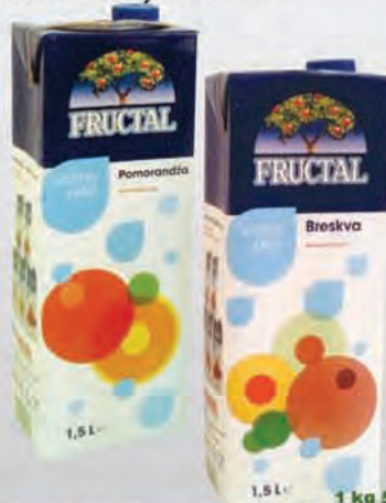
Voćno piće Fructal 1.5l : pomorandža, breskva