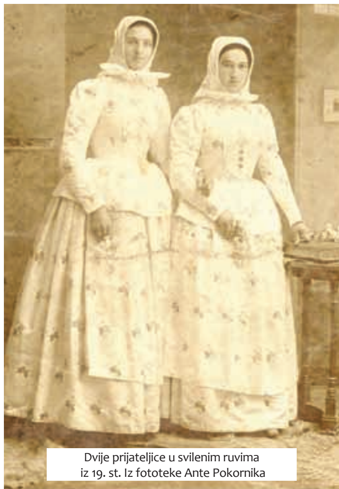
Dvije prijateljice u svilenim ruvima iz 19. st.

Karakterističan dio ženske bunjevačke nošnje jesu marame . Povezivale su se na glavu