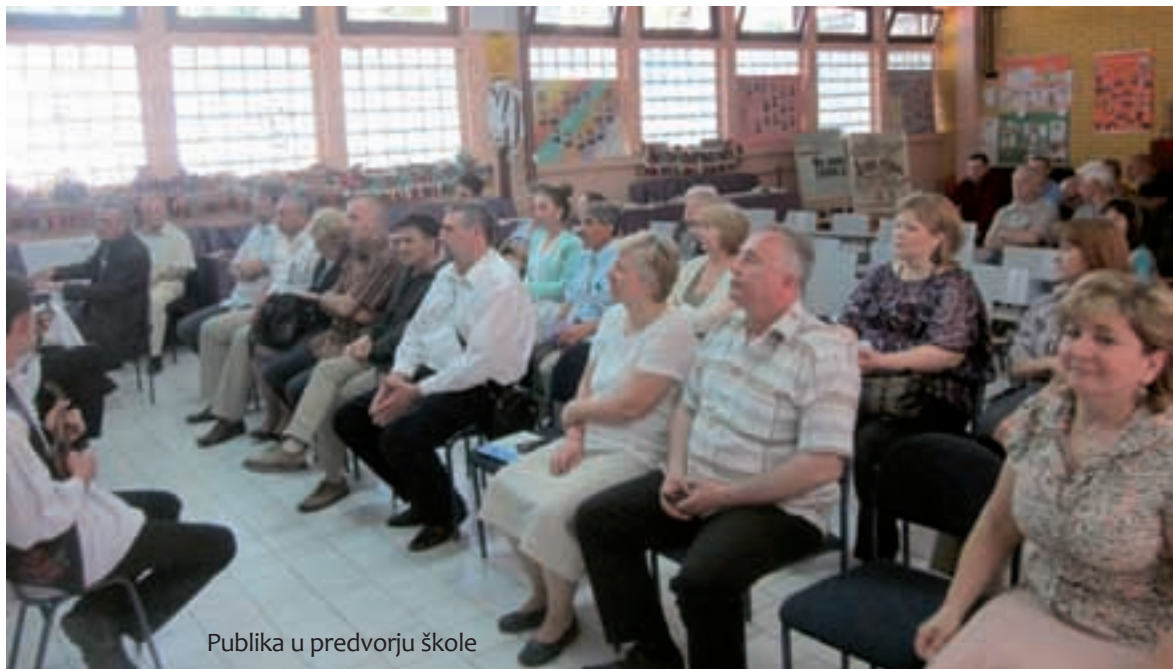
Publika u predvorju škole