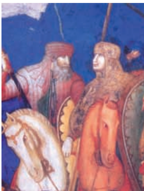
Pietro Lorezetti: Talijanski konjanici-plaćenici (dio freske)

(od talijanske riječi za zastavu), u to doba cca. 1000-2500 vojnika, zatim banderie baruna i vodećeg svećenstva, biskupa i nadbiskupa, kardinala. Obično je angažirana i kraljevska županijska stajaća vojska jobagiones castri , po jednoj županiji 400 boraca, s onih teritorija koji su bili najbliži teritoriju »države« na koju se napadalo. U slučaju pohoda na Napulj sigurno su bili angažirani pripadnici županijske vojske iz slavonskih županija (u Dalmaciji