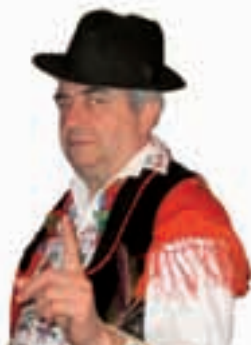
Piše: Ivan Andrašić