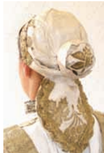
Bunjevka s kapicom, iz zbirke Petra Vojnića Purčara.

»roljane« (valjane vunene marama) obično tamnosive ili crne boje. U 20. stoljeću nose se ponajviše marame preko ramena od kumaše, svile i kašmira ukrašene zlatnim vezom ili pamučnim koncem raznih boja.