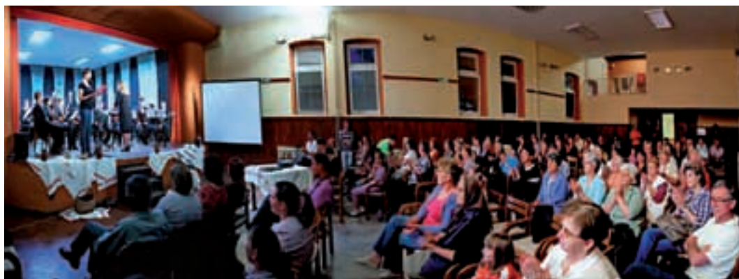
3. svibnja 2013.