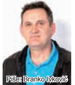
Piše: Branko Ivković

F aljen Isus čeljadi moja draga, ja evo niki sav zbunjnjen od ove dugačke zimetine. Nikako da se naviknem da ujutro netriba propaljivat, vuć gar, cipat drva... Doduše neću imat već ni šta propaljivat, šupa mi se već bome fajin osušila i nemam tamo još malo u čoš možda za još skuvat jedan dobar kotlič