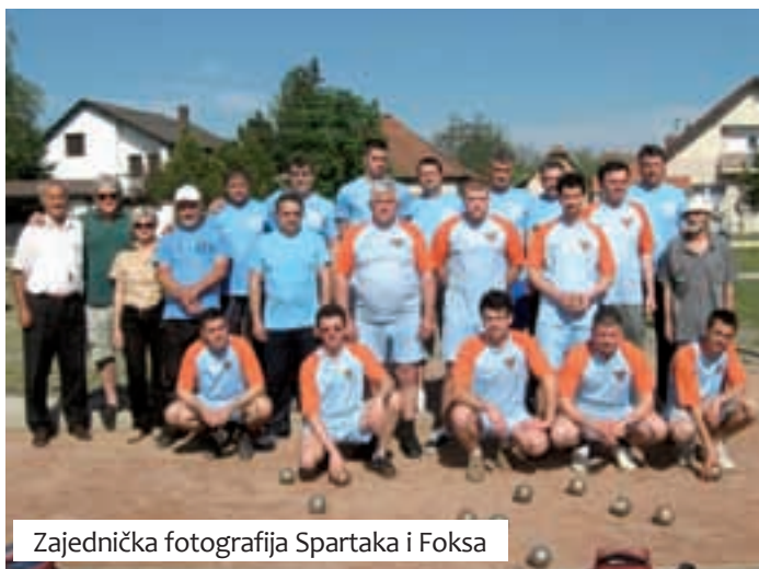
Zajednička fotografija Spartaka i Foksa

Nastupom u prvom kolu Druge lige, skupina Vojvodina sjever, BK Spartak je odigrao svoj povijesni susret