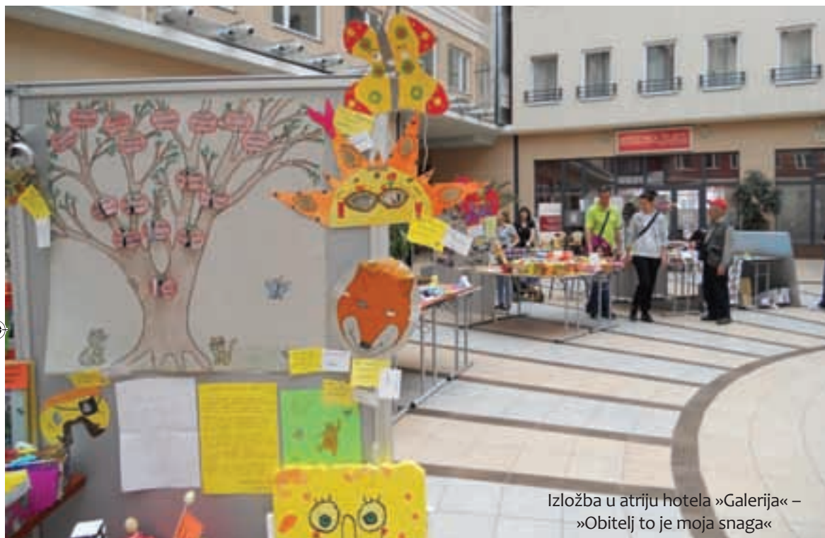
Izložba u atriju hotela »Galerija« – »Obitelj to je moja snaga«

Prvi interdisciplinarni simpozij na temu »Obitelj danas« posvećen analizi razolikih aspekata i uloga ove temeljne zajednice, problematici suvremene obitelji, kao i oblicima suradnje odgojnih i obrazovnih institucija i roditelja