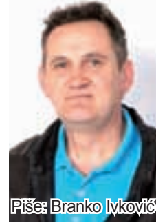
Piše: Branko Ivković

F aljen Isus čeljadi moja, jevo ja baš došo iz frljaze sa selvinog rova, natirala me ova moja da joj idem brat zove za niki sok, a tamo na rovu ima zove makar koliko, jeste da je malo možda ispolivana erbicidom, al pak mi smo već utrveni na te otrove pa nam već ni ne škode puno. Ta ja koliko puta protrčem biciglom kroz atar kad polivadu one velike njiwe, da kad dođem na salaš i kerovi bižidu od mene, kad bi i imo za čeg otić digod u kaku ajer banju došlo bi mi rđavo od friškog ajera pa bi me morali metit pored auspuha da dođem sebi, toliko sam se naviko. Šta da vam divanim, niki dan su nam ostavili one velike doboze za đubre u selu, mi lipo pokupili i oni nisu odneli pa nam i to zdravo lipo mriši, a sad će sveci, izgled mi kugod da kogod prkosi ovim našim svitu, za proštenje će nam bit puno selo džakova, al šta ćemo, što kazo moj drug posli oni izbora, iskali ste - nate. Neg da se ja ostavim politike, lipo sam sam sebi kazo još prijašnji godina da politika neće na moj salaš zakoracit, a opet mi ne da vrag mira pa se žderem s makar čime misto da gledim svoj poso, ja blejim u televiziju ko tele u šarena vrata i nerviram ovo lipo tilo, e pa više bome neću, otiću za nikoji dan ode u kancelariju i kast da me obrišedu sa sviju spiskova, nemoraje me više ni načeg zvat, i šta će, ja tijo opraviti malo slavlja ko kadgod si se lipo prijavijo i zakupijo salu, a sad »moramo pitat grad«, čovik bi štogod organizovo, na primer sastanak golupčara,