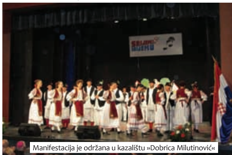
Manifestacija je održana u kazalištu »Dobrica Milutinović«

»Drago mi je da je napokon nakon više godina i više pokušaja organizirana zajednička manifestacija srijemskih hrvatskih udruga. Manifestaciju programski i organizacijski ocjenjujem kao vrlo uspješnu. Svakako da je to rezultat predanog rada članova naših udruga, i najveće zasluge pripadaju njima. Uspostavljanjem ove manifestacije obogatili smo našu manjinsku kulturnu scenu, i smatram je jednim od većih uspjeha koji je postignut u sadašnjem sazivu HNV-a na kulturnom planu. Nadam se da će svake sljedeće godine manifestacija dobivati na masovnosti i kvaliteti, te da će biti u kategoriji kulturnih manifestacija od značaja za hrvatsku zajednicu u Srbiji.«