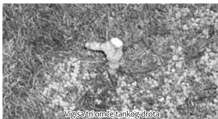
Vig sa tri omče tankog drota

Kad su za nekoliko dana namrsili čopor, na izabranom mistu utukli su u zemlju više vigova, kočica sa omčom od vrbice (deblje i jake uzice). Droplje su se vrtile po mistu dok se jedna nije nogom uple-