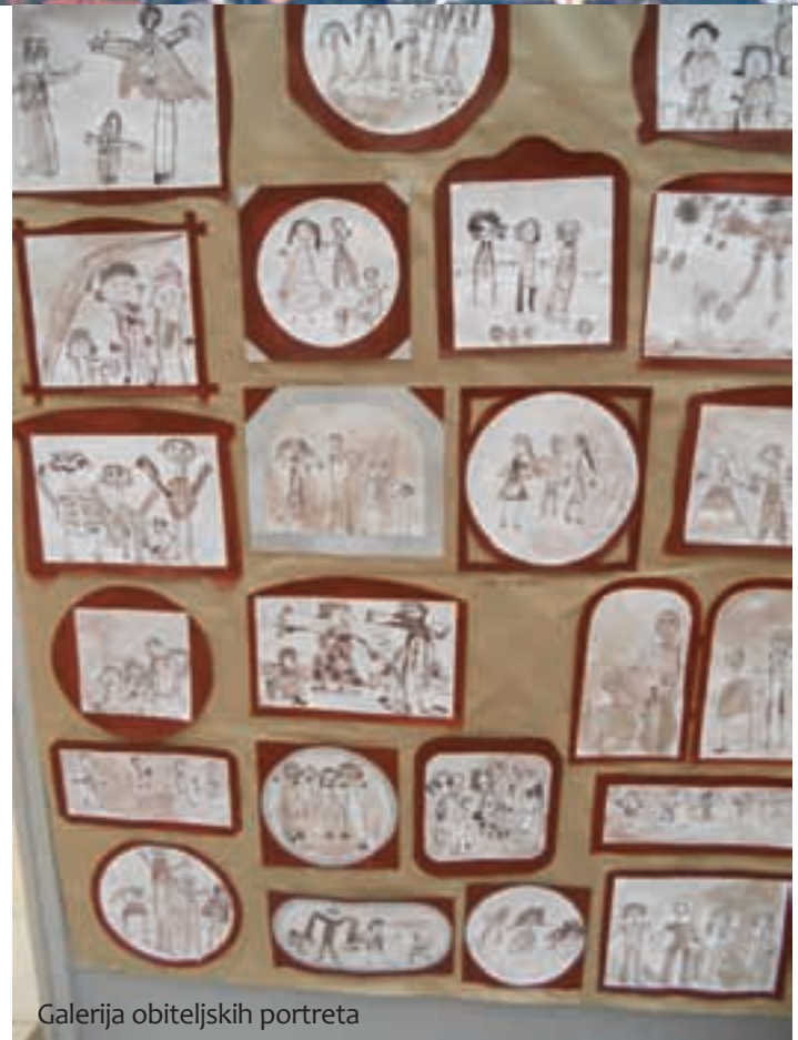
Galerija obiteljskih portreta

Egzistencijalne nedaće obitelji danas su toliko prevladale da su očite i u vrtićima, kroz nemogućnost roditelja isplatiti za prehranu ili materijal koji će djeca koristiti u različitim aktivnostima, recimo likovnim. Osim odgojne, ovdje predškolska ustanova dijelom obavlja i socijalnu funkciju. No, kada je u pitanju odgojna uloga, evo jednog zanimljivog primjera iz svakodnevne prakse, prezentiranog i na simpoziju, koji su izložile odgojiteljice Ksenija