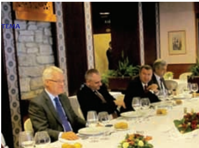
Predsjednik RH Ivo Josipović, dekan Fakulteta političkih znanosti u Zagrebu prof.dr.sc. Nenad Zakošek, savjetnik predsjednika RH za nacionalnu sigurnost Saša Perković i ravnatelj Instituta za migracije i narodnosti u Zagrebu dr.sc. Zlatko Šram

la plodom i hrvatski jezik je postao službeni jezik u vojvođanskom parlamentu. Naravno da nitko ne može pobjeći od sličnosti srpskog i hrvatskog jezika, međutim, kada govorimo o pravima nacionalnih manjina jezik je jedan od osnovnih elemenata identiteta nacionalne manjine».