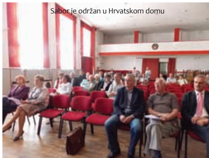
Sabor je održan u Hrvatskom domu