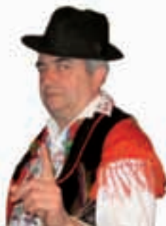
Piše: Ivan Andrašić