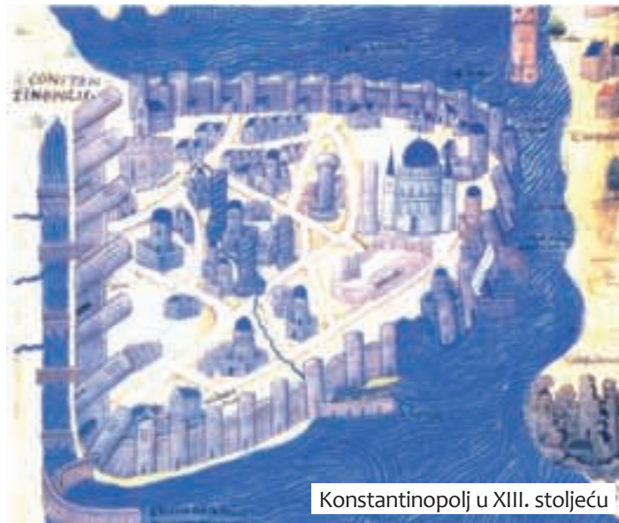
Konstantinopolj u XIII. stoljeću