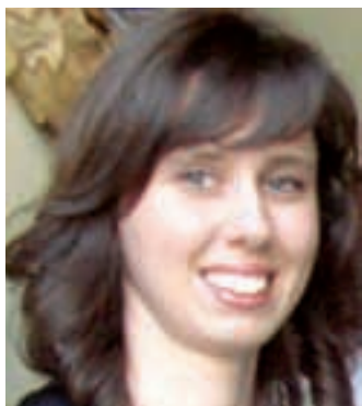
Piše: dipl. theol. Ana Hodak