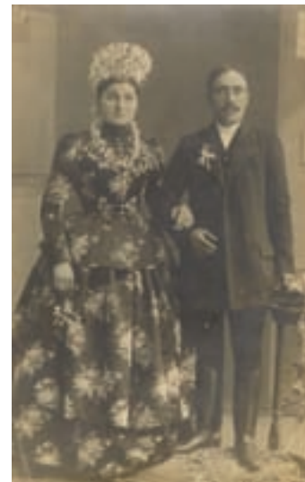
Snaša u svilenom ruvu (s kraja XIX. vika)

Posli pravljenja novi salaša imućnijima je doteklo novaca i da divojku što lipče oprave