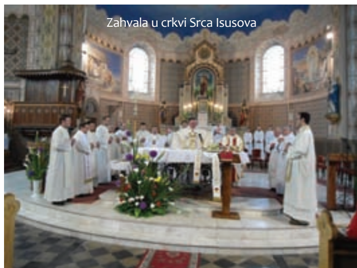
Zahvala u crkvi Srca Isusova

sportski program na župi. Na tribinama mladih u Subotici svakog je mjeseca sudjelovalo oko dvadeset Somboraca. Kada sam premješten u Tavankut, znao sam gdje dolazim. Ovu sam župu poznao jer u njoj imam puno poznanika i rodbine. Biskup me je iznenadio novim dekretom. U Tavankutu djelujem nepunih petnaest godina. I ovdje sam doživio mnoga nezaboravna divna iskustva u radu sa sve tri zajednice koje su mi povjerene. Moram naglasiti da imam izvrsnu suradnju s upravom škola u kojima radim više od deset godina. I u novije vrijeme ima onih koji se odazivaju Božjem glasu. Drago mi je što su mlađa subraća otvorena za suradnju i rado pomažu. Lijepo je biti radnik na Božjoj njivi. Svakodnevno doživljam kako druge i mene Bog silno voli. To me još više