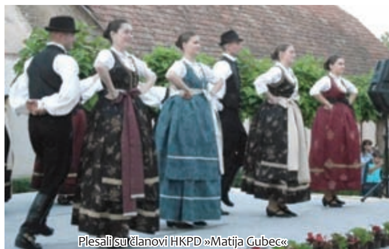
Plesali su članovi HKPD »Matija Gubec«