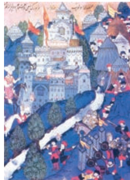
Bitka kod Nikopolja, turska minijatura, na slici lijevo sultan Bajazid

Za divno čudo europska se vojska iduće 1396. godine u ljeto počela okupljati pokraj Budima. Najznačajniji kontingent je bio francuski (oko 15.000 vitezova oklopnika), iz Engleske je pristiglo oko 5.000 oklopnika. Ove su vitezove vodili pripadnici kraljevskih kuća. Dolazili su i vitezovi iz Italije, Češke, Njemačke, Austrije i naravno