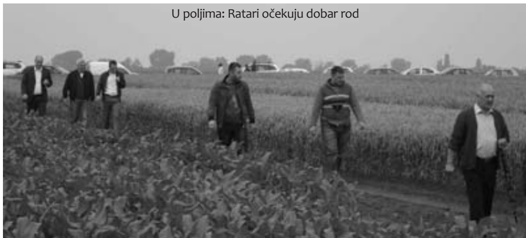
U poljima: Ratari očekuju dobar rod

proizvodnje pšenice bio je 20 do 30 posto veći, pa uz dobar rod ratari ističu kako bi minimalna cijena koja bi pokrila