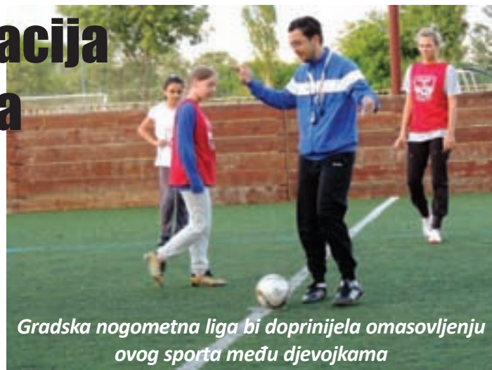
Gradska nogometna liga bi doprinijela omasovljenju ovog sporta među djevojkama

»Prije tri tjedna započela je s radom škola nogometa pri Spartaku, što je bilo i zacrtano