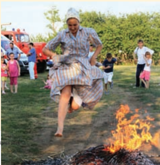
14. lipnja 2013.

Program »Priskakanja vatre na Sv. Ivana Cvitnjaka« započet će paljenjem vatre, koju će preskakati i kroz koju će skakati mladi obučeni u nošnju, a potom i prisutni posjetitelji. Nakon preskakanja vatre, članovi folklorne skupine HKC-a »Bunjevačko kolo« prikazat će običaj igranja parovnih bunjevačkih igara s vijencima od ivanjskog cvijeća i običaj stavljanja vijenca od ivanjskog cvijeća iznad ulaznih vrata salaša gdje će posjetitelji do sljedećeg Cvitnjaka, s vjerovanjem da će ovaj svetac zaštititi salaš od groma ili vatre.