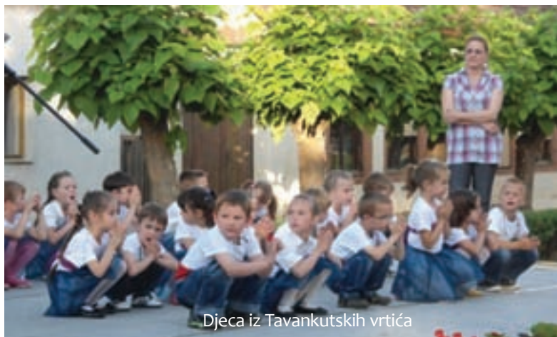
Djeca iz Tavankutskih vrtića