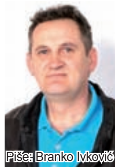
Piše: Branko Ivković

ovi kojikaki huncutarija iz ovi novi veliki dućana, izem ti odem u dućan pa se izgubim u njem, a i vrime provardam. Dok ne obađe čovik sve redove ode mu po nadnice koliko izgubi vrimenta, a kad dođeš kući budeš i ružen di si dosad, ko bajage još i falim. Čeljadi moja bome već dudova nema ni u šoru, samo digod koji, a kadgod se samo taka rakija dudara pekla, pa pilež se imo čime sladić, čeljad su ručala dogod je bilo na drvetu, a sad se svit popišmanijo pa već neće ni šunke da ide, kobajage dobit će olisterol. E bome tog kadgod nije bilo dok se vuklo đubre iz korlata, pa oralo konjima, radio ris i vrlo na mašini, e to su bila vrimenta, a sad doduše tog posla nema, a ni rana nije prava, već nika najlonske kože ko ova hebridna paradička što čim je posade znadu ko joj bačo ko nana, a to božem prosti kadgod nisu znali ni za ljude, pa kad se pitalo na koga je dite kazli su onako bisno »na božiju priliku«, a to je bijo znak da više ne pitaš jel moš dobit po mašini za divan. Neg jel se vi spremate na proštenje u Tavankut, mi odaleg iz Male Bosne se bome spremamo, ta svako ima kakog roda, jel drugara pa će se upajtašit i otić, tako su i oni na naše proštenje rado viđeni gosti i tako to od uvijek biva, a to je i lipo kad se vidi da ova naša mladež veselo i radosno slavi, a onda se i mi matori nuz