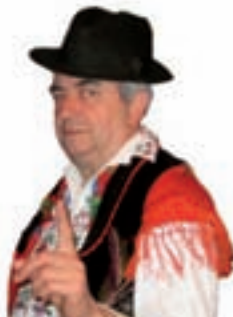
Piše: Ivan Andrašić