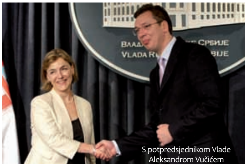
S potpredsjednikom Vlade Aleksandrom Vučićem

Potpredsjednica DSHV-a Vesna Prčić kaže: »DSHV kao jedina parlamentarna stranka u potpunosti prihva-