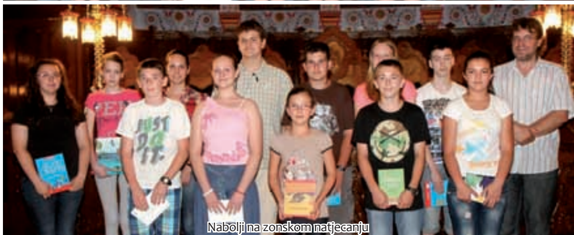
Nabolji na zonskom natjecanju