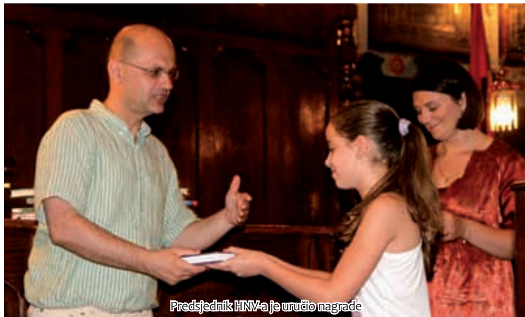
Predsjednik HNV-a je uručio nagrade

1. srpnja i službeno postaje jezik Europske Unije. Hvala roditeljima na strpljenju, hvala djeci na ovim iznimnim naporima. Doista vam želim da sljedeću školsku godinu