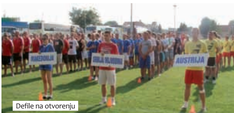
Defile na otvorenju