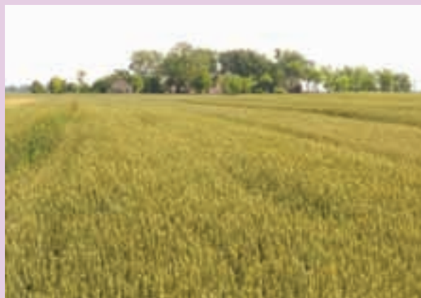
Salaš u moru žita!

Balzac: Tko može upravljati jednom ženom, može i cijelim narodom.