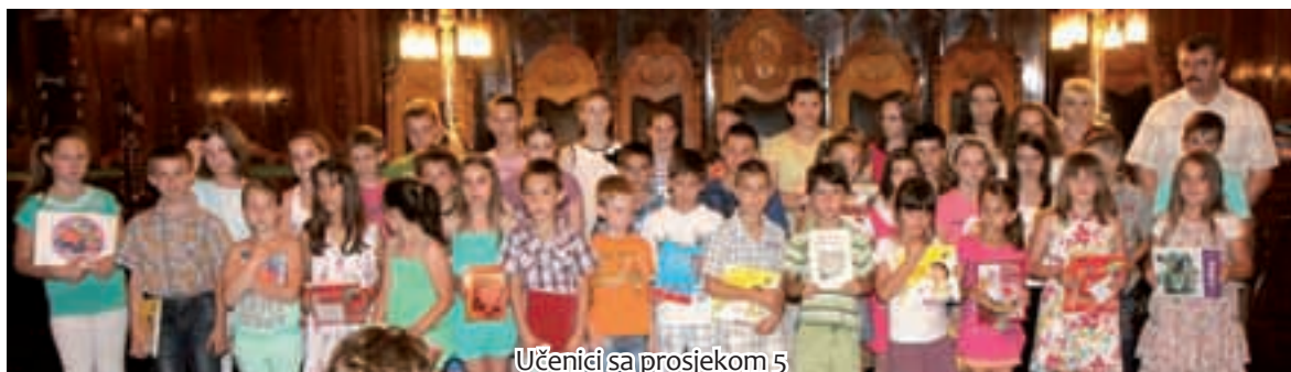
Učenci sa prosjekom 5