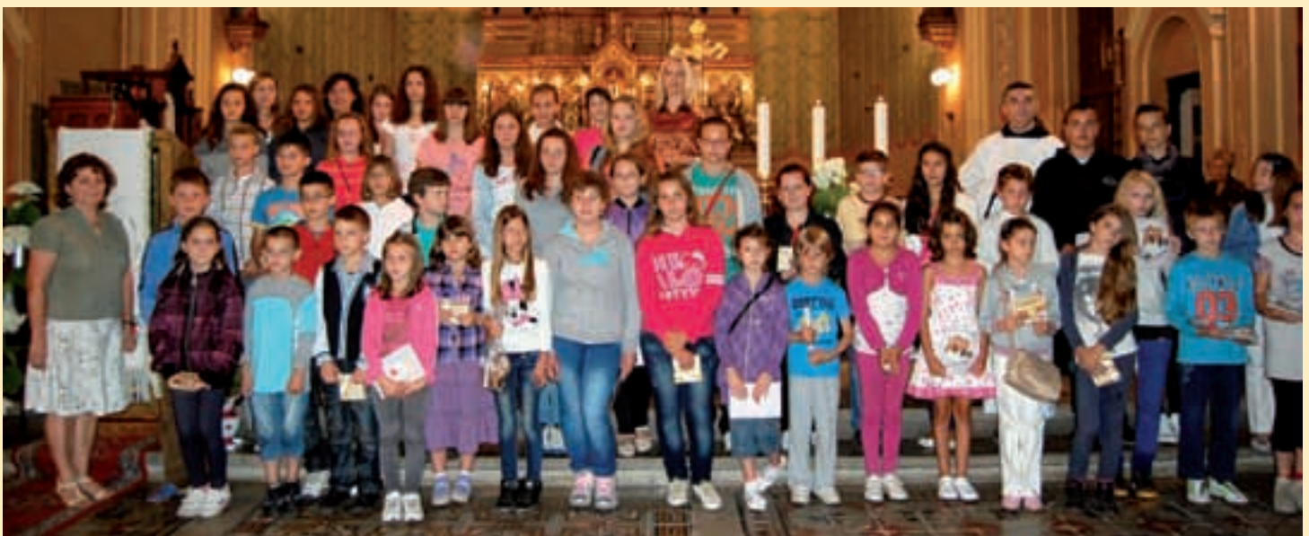
Petero prvonagrađene djece putovat će u Zagreb