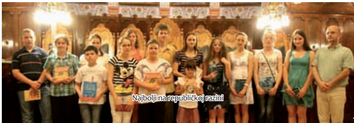
Najbolji na republičkoj razini