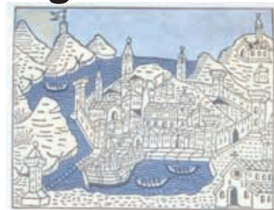
Veduta Dubrovnika 1481. godine

Izreka kaže – da bi nekom svanulo, mora nekom smrknuti. Kralj Sigismund se praktički odrekao Dalmacije, koja je ostala pod mletačkom vlašću, sve do propasti Mletačke Republike 1797.