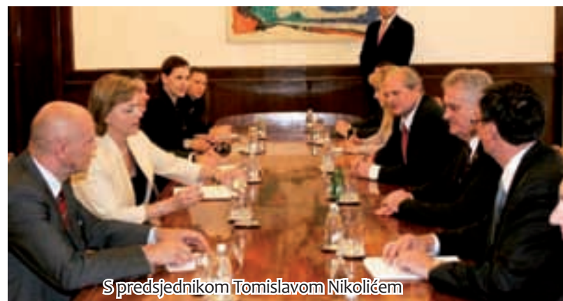
S predsjednikom Tomislavom Nikolićem

»Iznijeli smo aktualne teme, poput provedbe odredaba međudržavnoga Sporazuma o zaštiti manjina, koje se odno-