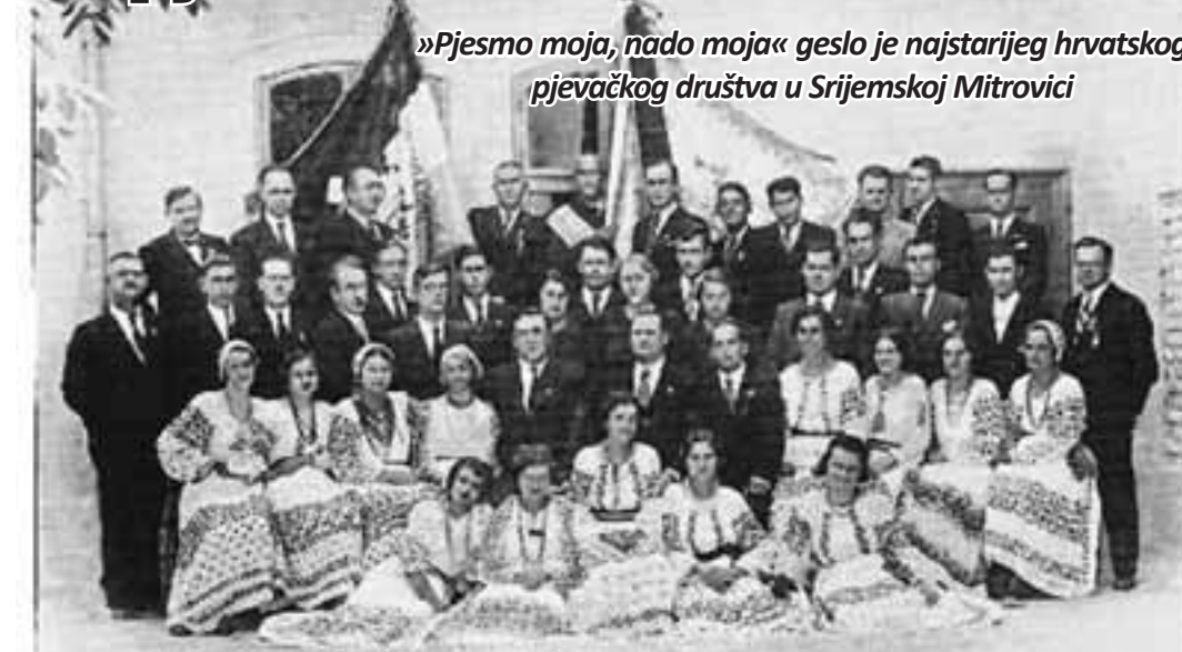
»Pjesmo moja, nado moja« geslo je najstarijeg hrvatskog pjevačkog društva u Srijemskoj Mitrovici