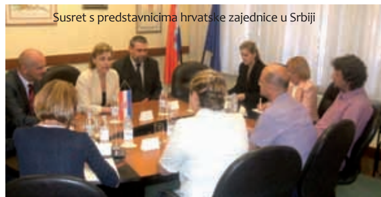
Susret s predstavnicima hrvatske zajednice u Srbiji

Nakon sastanka je pred medijima prvi potpredsjednik Vlade Srbije Vučić uputio čestitke Hrvatskoj povodom ulaska u EU, uz želju