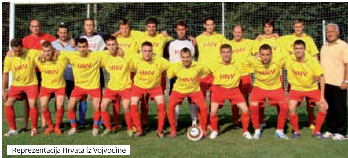
Reprezentacija Hrvata iz Vojvodine

»Da smo poslije podne igrali s Austrijom, bila bi to druga priča. S reprezentacijom Hrvata iz Vojvodine sam od njenih samih početaka, a