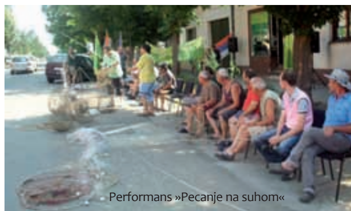
Performans »Pecanje na suhom«

Kako su istaknuli organizatori prosvjeda, ovaj performans je samo nastavak tradicije pecanja na trgovima koji je