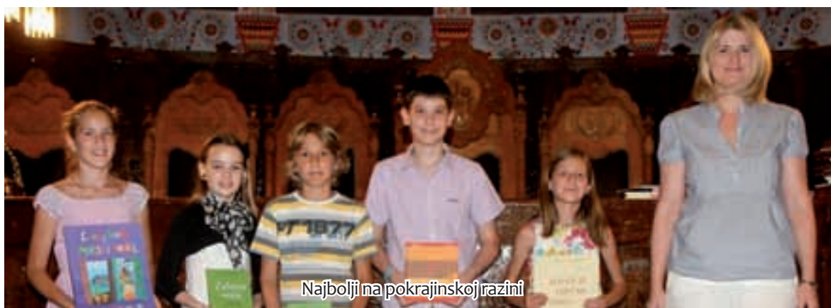
Najbolji na pokrajinskoj razini