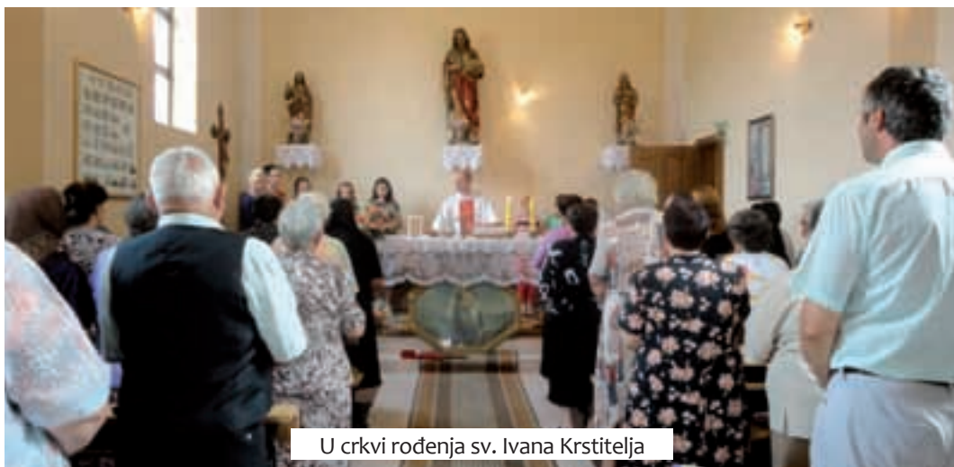
U crkvi rođenja sv. Ivana Krstitelja

U dvorištu župne kuće napravljeno je malo dječje igralište s nekoliko dječjih igračaka