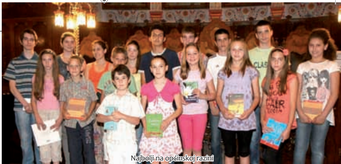
Najbolji na općinskoj razini