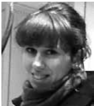
Piše: dipl. theol. Ana Hodak

Isus je za vrijeme svog javnog djelovanja navijestao kraljevstvo Božje te zahtijevao nasljedovanje. Da bi prikupio što veći broj sljedbenika nikada nije uljepšavao ono što ih očekuje ako krenu za njim. Jasno je uvijek naglašavao da onaj koji ide za njim može očekivati puno poteškoća i protivština na ovom svijetu, ali plaća ga čeka na nebu. Tako smo čitali u evanđelju prošle nedjelje kako Isus vrlo realno govori o tome što znači biti njegov nasljedovatelj, a ove nedjelje on, isto tako bez uljepšavanja, govori svojim učenicima što ih čeka na putu na koji ih šalje.