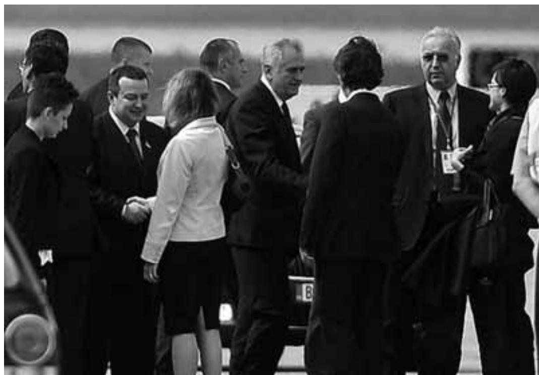
Srdačni doček Nikolića i Dačića

Tanjug pak izvještava kako je hrvatski predsjednik Ivo Josipović bio domaćin radnog doručka za čelnike država regije, na kojem je sudionik bio i predsjednik Nikolić, sva trojica članova Predsjedništva BiH, slovenski predsjednik Borut Pahor , makedonski predsjednik Đorđe Ivanov , crnogorski predsjednik Filip Vujanović , albanski predsjednik Bujar Nishani i kosovska predsjednica Atifete Jahjaga . Bila je to zajednička inicijativa predsjednika Hrvatske i Slovenije, kako bi se promovirala regionalna suradnja, te je on bio neformalan, bez isticanja državnih obilježja. Tome su prethodili neformalni razgovori na terasi Pantovčaka. Nikolić je sjedio između predsjednika Albanije i Makedonije, da bi se nakon ovog radnog doručka vratio u Beograd.