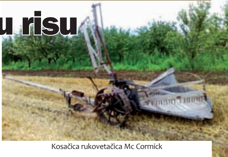
Kosačica rukovetačica Mc Cormick

Držimo važnim pokazat u radu ovu kosačicu jel je ona prvi velik iskorak u sridini XIX. vika, kad su naši poljodilci privatili novotarije iz svita. Prvu kosačicu koja se mogla hasnirat u risu napravio je Amrikanac Cyrus Hall McCormick 1831., a pokazana je u Europi (Beč, 1851.). Friško je dospila i u naš atar jel je zabiluženo da je 1860. Kalor Sarić na nju plaćo porciju (porez). To pokaziva koliko su onda pratili događanja u svitu, jel su se i naši poljodilci privatili novog nauka gazdovanja. Pokazalo se da žita mož prodat i više neg koliko ga odrane (proizvedu) poljodilci, pa su rad plodoreda sve više sijanog žita sijali i druge žitarice, najviše kuruze, a nji je najunosnije prodat kroz odranjen i ugojen josag. S josagom je poljodilac prodo