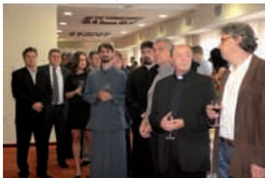
Među uzvanicima i predstavnici crkava