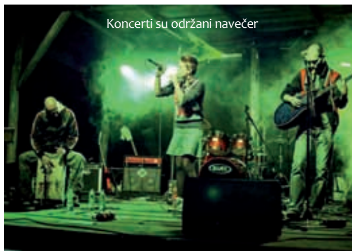
Koncerti su održani navečer