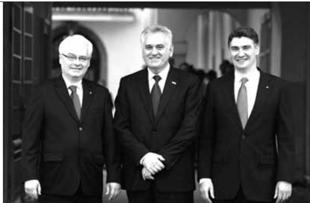
Predsjednici Ivo Josipović, Tomislav Nikolić i premijer Zoran Milanović

U opisima detalja s proslave i večere mediji su