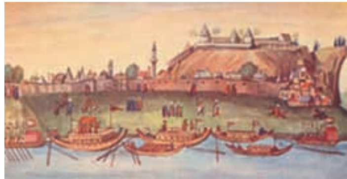
Zemun u tursko doba, početak XVI. stoljeća, zidom okruženi gornji i donji grad

Pri pravnoj regulaciji ugarski kralj je početkom XV. stoljeća pravno uredio jednu urbanu pojavu, vodeći se antičkim principima, po