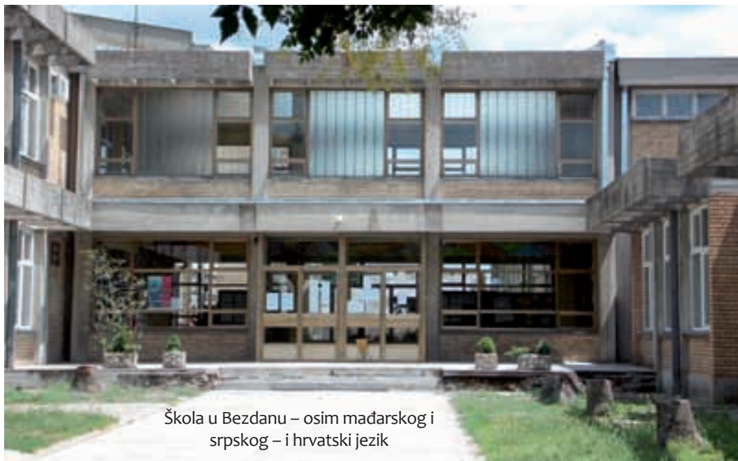
Škola u Bezdanu – osim mađarskog i srpskog – i hrvatski jezik

U Osnovnoj školi »Bratstvo-jedinstvo« u Bezdanu od sljedeće školske godine učenici će fakultativno pohađati predmet hrvatski jezik s elementima nacionalne kulture. Za ovaj izborni predmet do sada se izjasnilo dvadesetak učenika. To će biti prvi put da se u bezdanskoj školi uči hrvatski jezik.