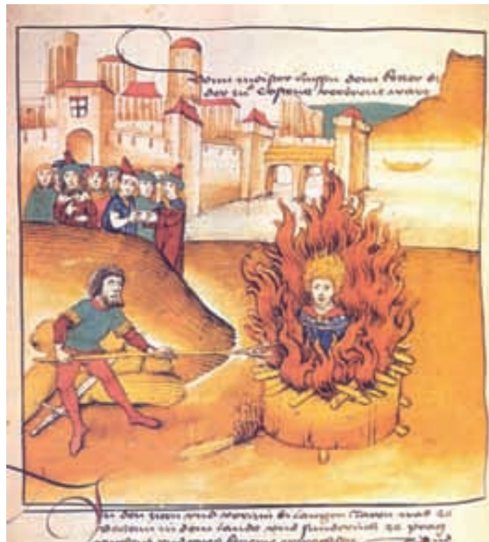
Jan Hus na lomači, ilustracija iz 1484. godine

Husitizam su u Srijemu širili mađarski vjerovjesnici i po tadašnjim izvješćima raširio