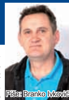
Piše: Branko Ivković