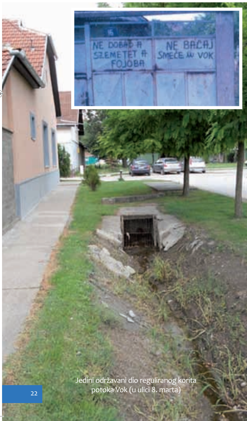
Jedini održavani dio reguliranog korita potoka Vok (u ulici 8. marta)

Subotica nema rijeku u čijoj bi obali stanovnici danas uživali, ali ispod tla, a ponegdje i na svjetlu dana, još šume i teku stari potoci, u cjevovodima i izvan njih, svojim starim i novim stazama, a one ne mogu uvijek biti samo po volji čovjekovoj. Priroda je to ... U vrijeme kada je grad nastajao i rastao, vodotokovi su bili njegov sastavni dio, valjda nevoljan, kada niti jedan od njih nije sačuvan i ugrađen u današnji izgled grada.