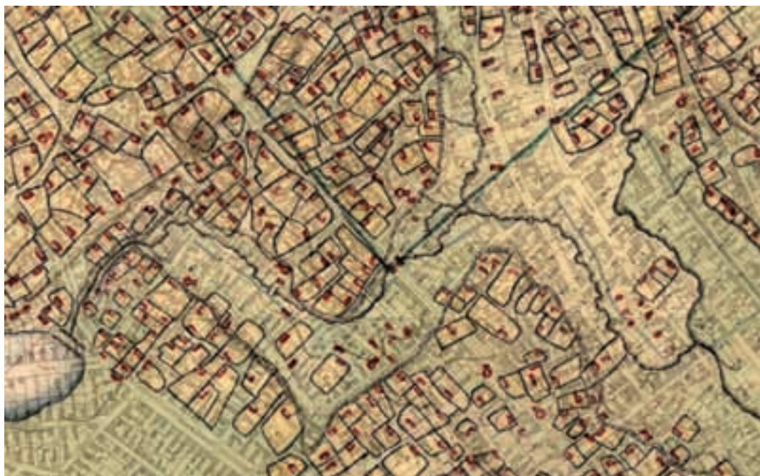
Stari tok Voka od Gundulićeve ulice do Mlake. U sredini karte vidljiv je propust preko Beogradskog puta, a desno tri izvora blizu današnje Ulice Matije Gupca