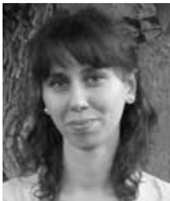
Piše: dipl. theol. Ana Hodak

E vangelje, kao nepresušni izvor poruka i usmjerenja za život, u šesnaestoj nedjelji kroz godinu stavlja pred nas Isusov susret s Martom i Marijom u njihovoj kući (Lk 10, 38-42). Što nam ovaj susret poručuje, što nas Isus želi poučiti?