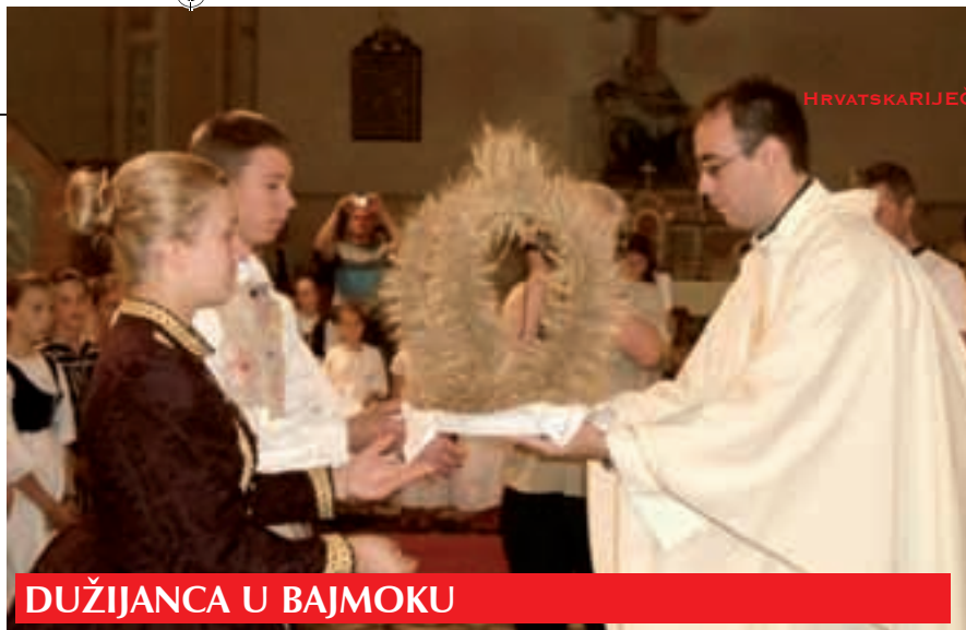
DUŽIJANCA U BAJMOKU