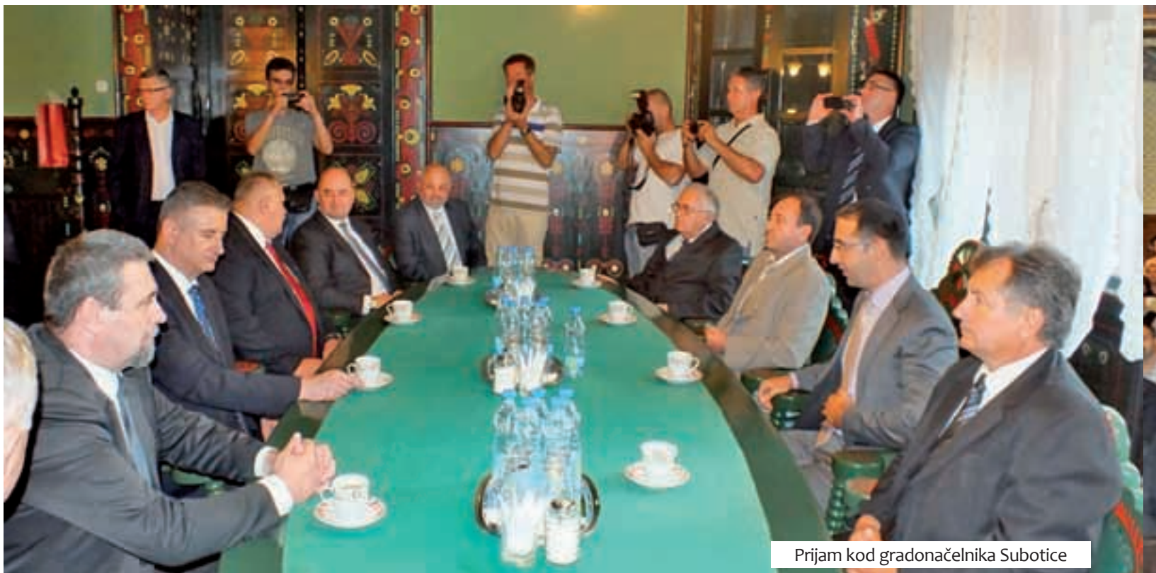
Prijam kod gradonačelnika Subotice