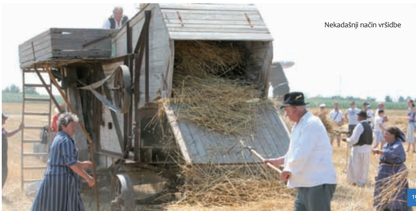
Nekadašnji način vršidbe