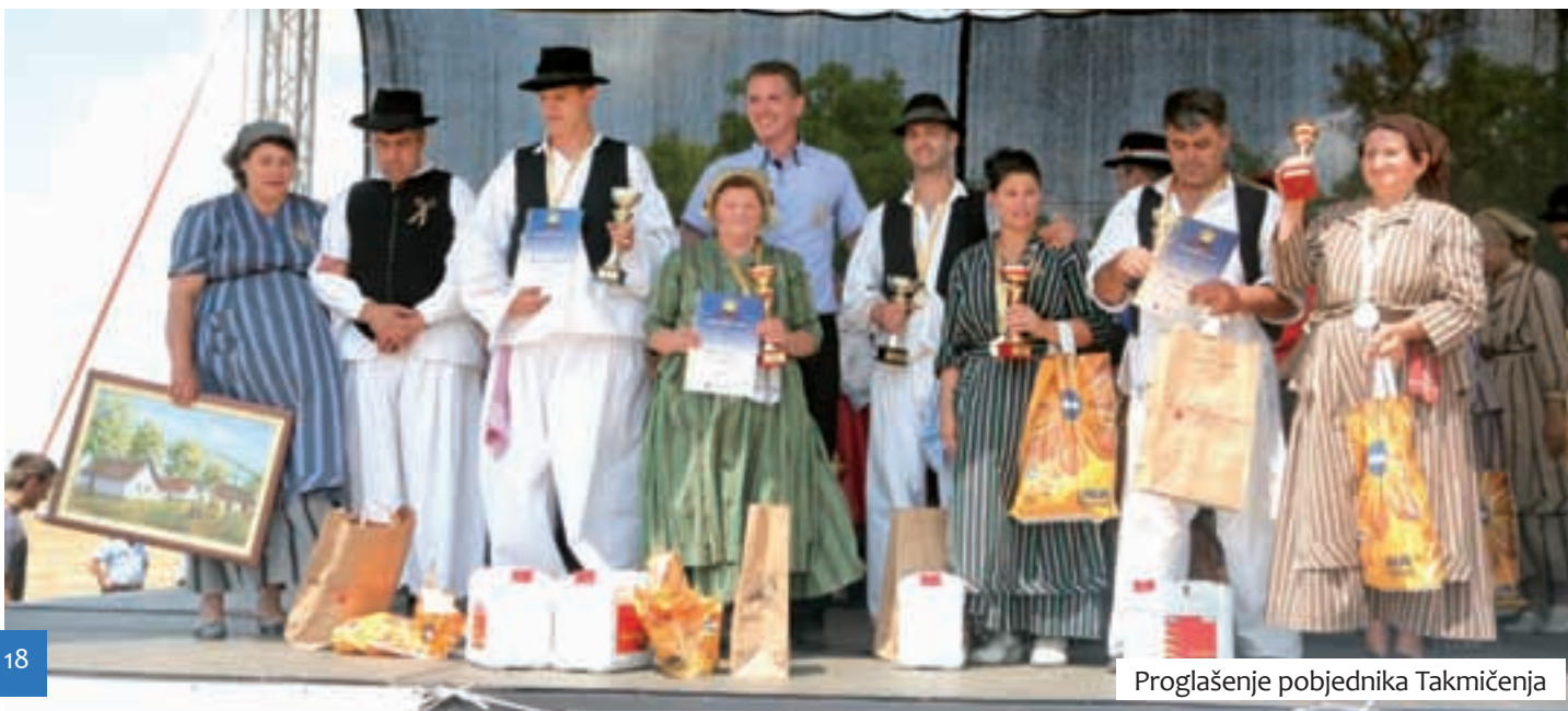
Proglasenje pobjednika Takmičenja

I ovlaštteni prodavači pića (u daljnjem tekstu OPP) potrudili su se da ovogodišnje »Takmičenje risara« bude drugačije od mnogih ranijih. Netko od OPP-ovaca, ili možda i svi oni, dosjetili su se da je upravo ova manifestacija prava prigoda za oživljavanje jednog starog običaja: podizanja cijene artikla nakon protoka kraćeg vremena. Kao što se stariji vjerojatno sjećaju prije 20 godina na mnogim je mjestima bio običaj da cijena robi s prijedpodnevnih 180 u poslijepodnevnim satima poskupi na 426 milijardi dinara. Sjetivši se davnog i divnog običaja, cijena piva kod OVP-ovaca u 8 je sati bila 100, a u 9 već 150 dinara. Za utjehu, cijene ostalih artikala hrabro su zadržali istima do fajronta.