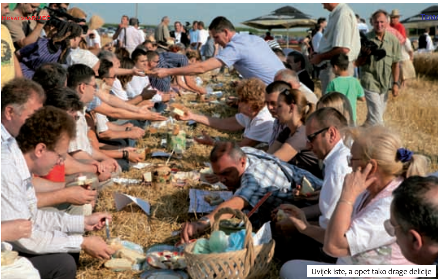
Uvijek iste, a opet tako drage delicije