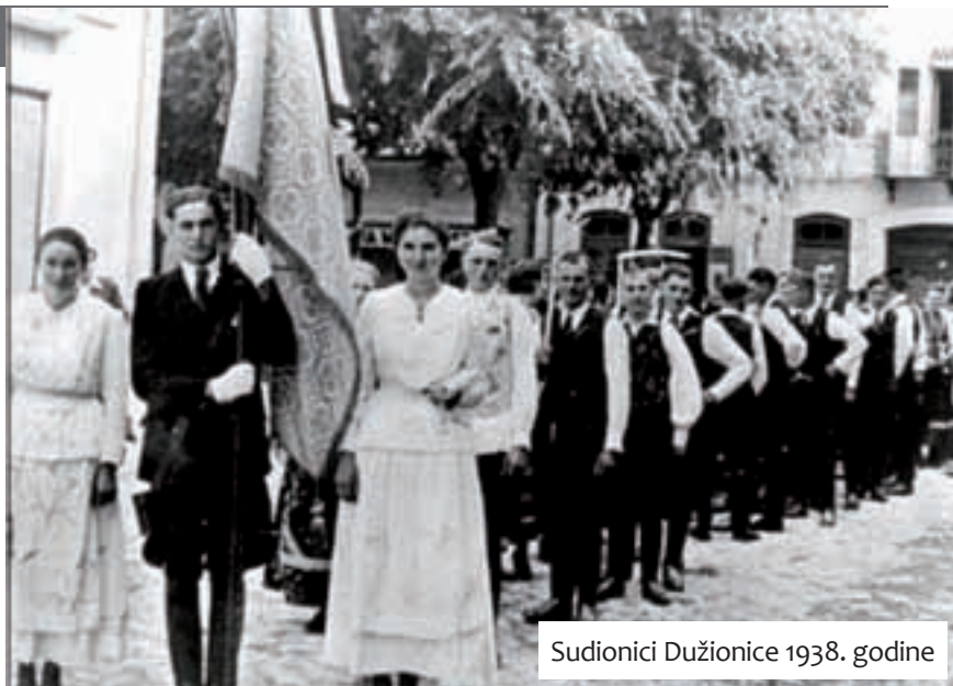
Sudionici Dužionice 1938. godine

Šezdesetih godina prošloga stoljeća, zahvaljujući tadašnjem župniku župe Presvetog Trojstva Ivanu Jurigi , Dužionici će ponovno biti vraćen prijašnji sjaj. I dalje nije bilo svečanih povorki na gradskim ulicama, ali se išlo svečano u crkvu na misu zahvalnicu. Narednih godina počele su se dužionice organizirati i na okolnim somborskim salašima, Bezdanskom putu, Nenadiću, Gradini... Bile su to masovne i lijepe dužionice, risari i risaruše išli su jedni kod drugih, a proslava se završavala igrankama u domovima kulture. Salašari s Bezdanskog puta imali su svečanu misu u svojoj crkvi Nikole Tavelića, gdje se posvećivao kruh od novoga žita. Na misi su se okupljali vjernici s Bezdanskog puta i iz Male Pešte. Glavna Dužionica i dalje je u crkvi Svetog Trojstva, a okupljanje, ručak i igranka u Hrvatskom domu. No, kako je na salašima mladeži bivalo sve manje tako su nestale i dužionice. Posljednja Dužionica na salašu održana je 1990. godine na Nenadiću. Kako su nekada bile lijepe dužionice na salašima danas se rado sjećaju nekadašnji sudionici, koje na to podsjećaju još samo foto-