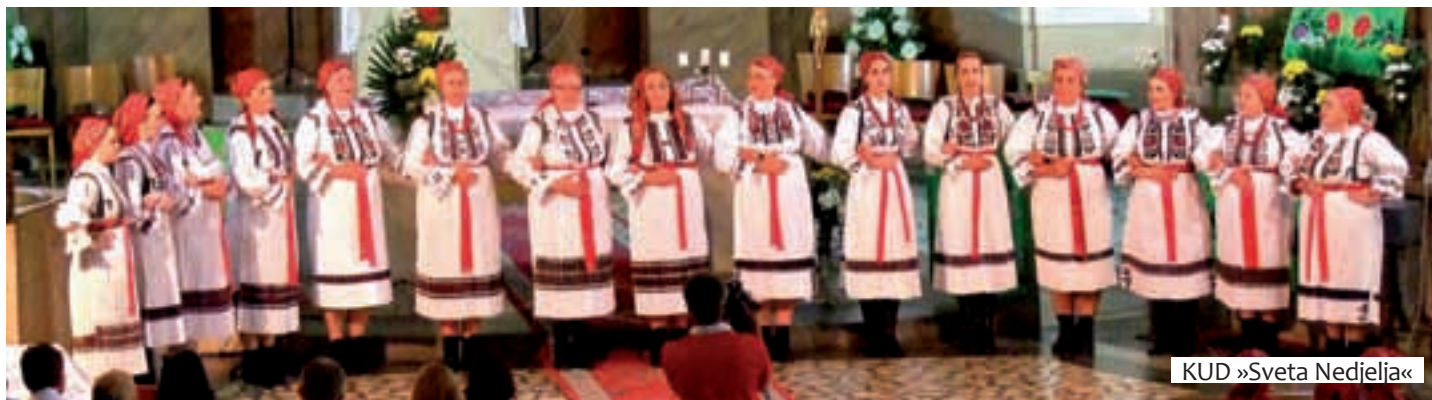
KUD »Sveta Nedjelja«