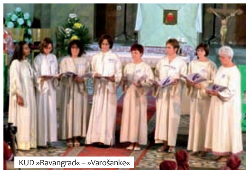
KUD »Ravangrad« – »Varošanke«