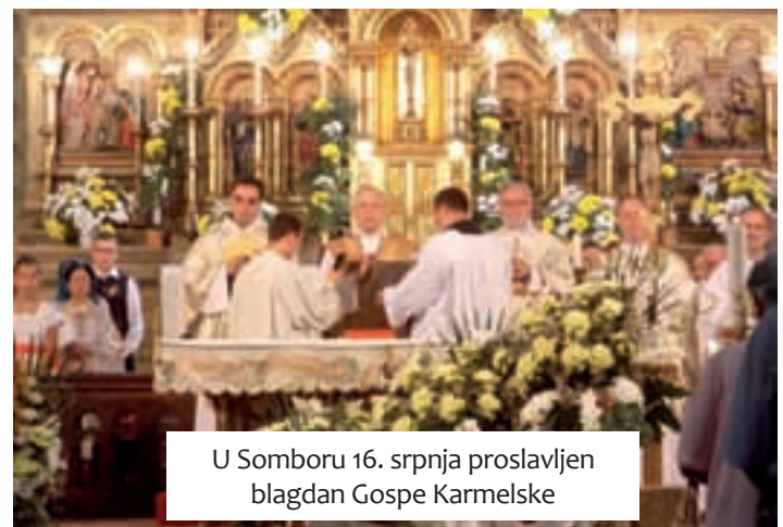
U Somboru 16. srpnja proslavljen blagdan Gospe Karmelske