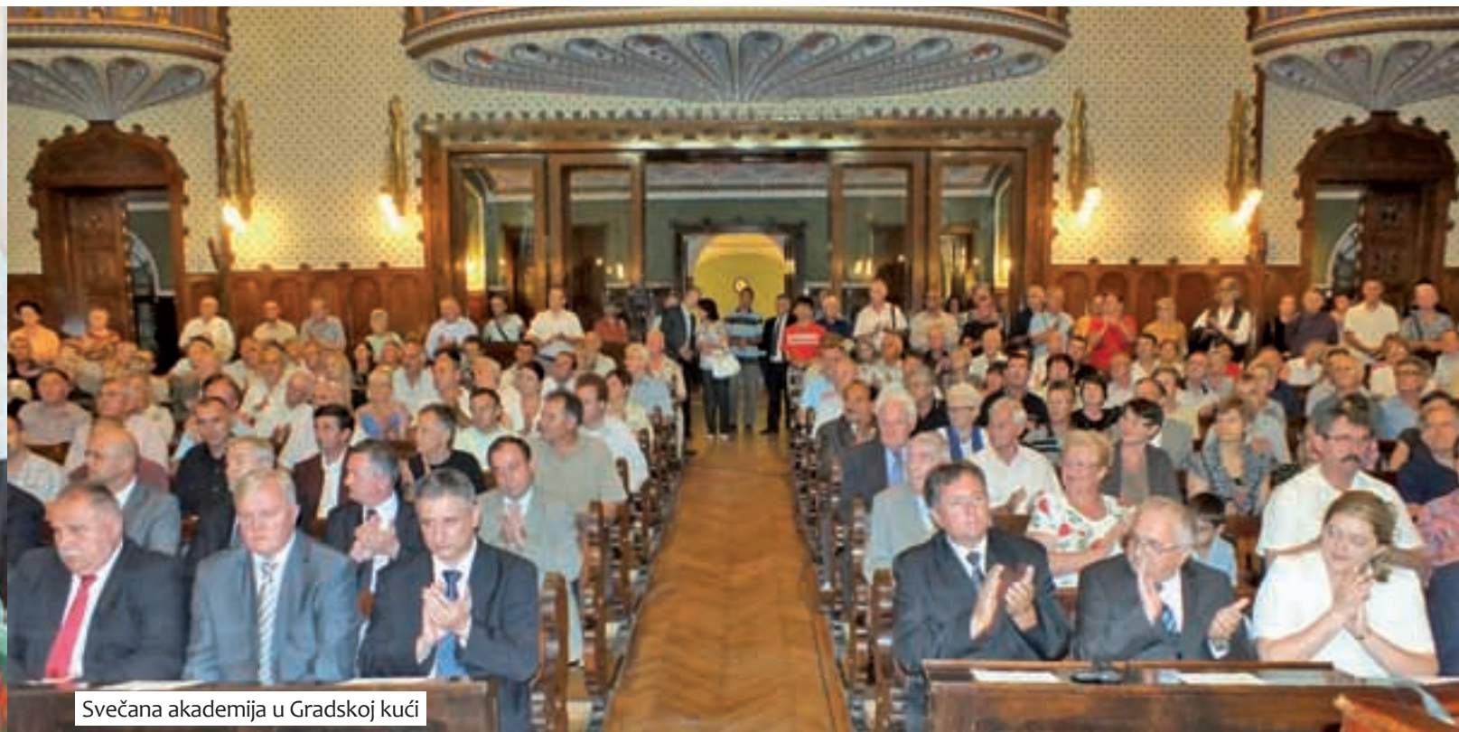
Svečana akademija u Gradskoj kući

tačno oporba, ali kada dođe na vlast u Hrvatskoj više će se angažirati oko prava hrvatske manjine u Srbiji. »Rekao bih kako je ambijent Hrvatske sa svojim susjednim državama jako dobar, on je prijateljski, mi gradimo te mostove, trgovimo, gospodarstvo funkcionira manje ili više uspješno, ali što se tiče prava nacionalnih manjina ne možemo biti zadovoljni. Ne možemo biti zadovoljni jer se trudimo u Hrvatskoj da svaki naš sugrađanin bilo koje on nacionalnosti bio, ima doista europski standardizirana ljudska prava i prava nacionalnih manjina. To ćemo tražiti i za Hrvate u Republici Srbiji. Naravno, ne govorim da je taj status kritičan, da je loš, ali mislim da se uvijek može više. Mene osobno smeta pojava nekih novih nacionalnosti koje idu na uštrb našeg hrvatskog nacionalnog korpusa, ali kad dođemo na vlast mi ćemo o tome popričati s našim prijateljima u Beogradu«, kazao je Karamarko, te kao svog