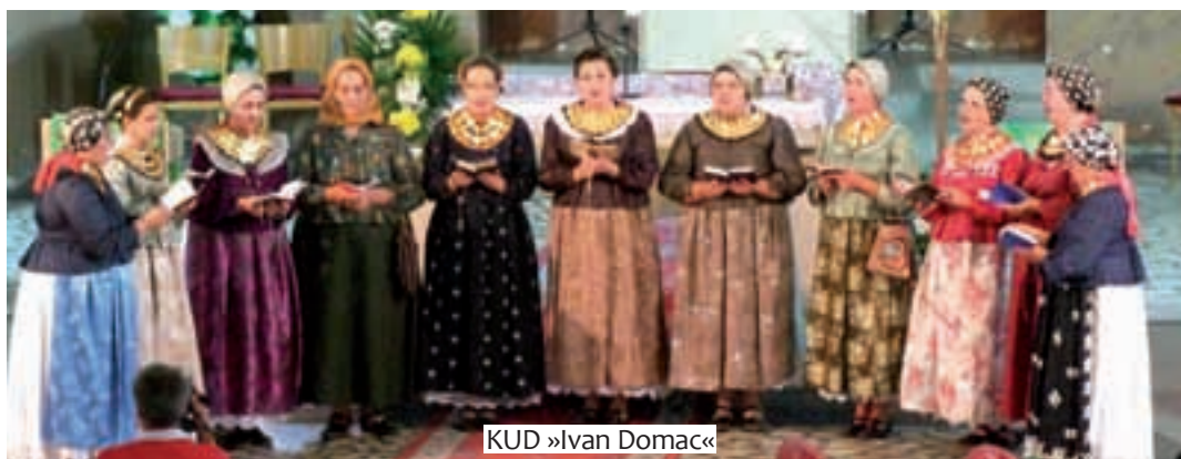
KUD »Ivan Domac«