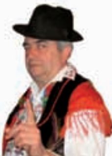
Piše: Ivan Andrašić