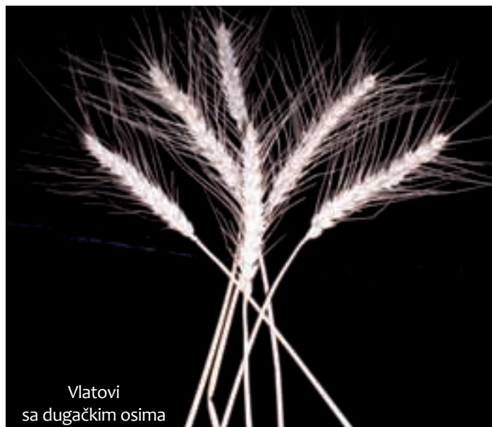
Vlatovi sa dugačkim osima

U obaško ostavljenom nepokošenom žitištu dočekali su zrna za sime da sazriju bar na 16-15 posto vlage, pa makar se malo i krunilo, ali taj mali gubitak su podneli jel su dobili prirodno osušena zrna podesna za sijanje. Snopove sa zrnima za sime u žitnoj