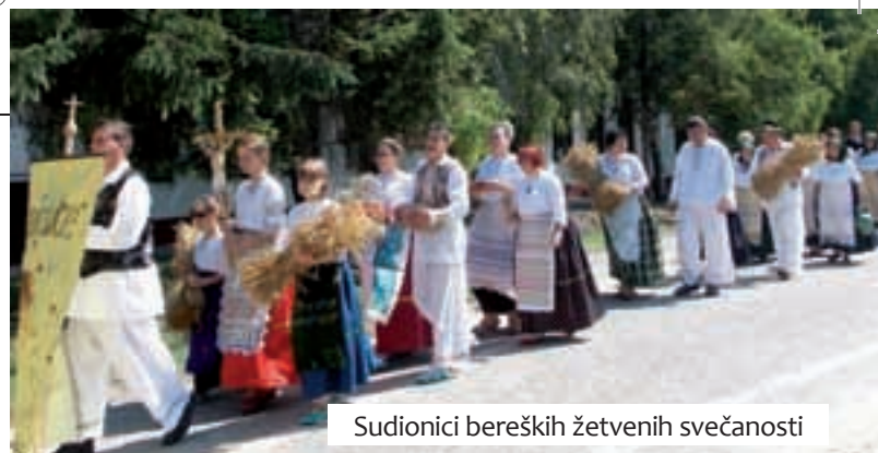
Sudionici bereških žetvenih svečanosti