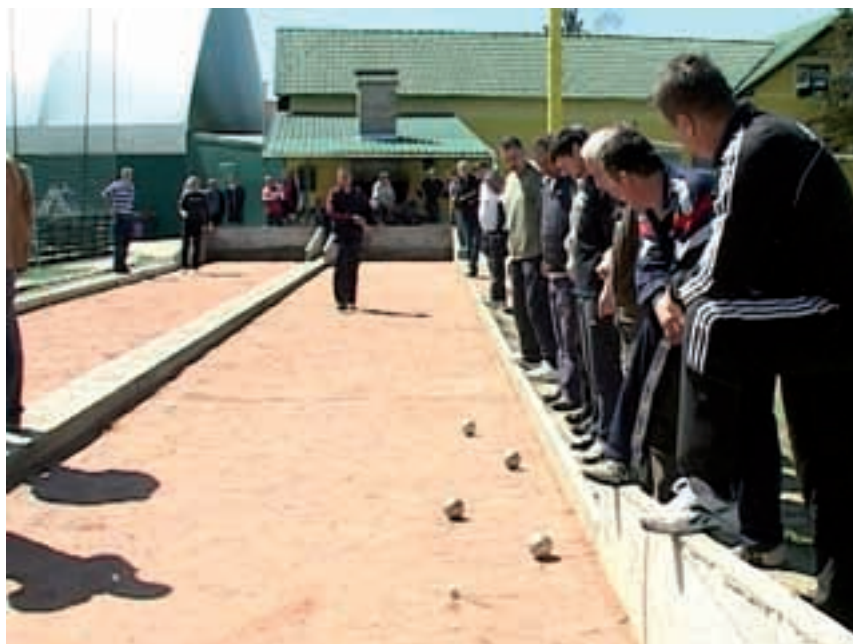
Natjecanja u boćanju održavaju se na terenima na Makovoj sedmici