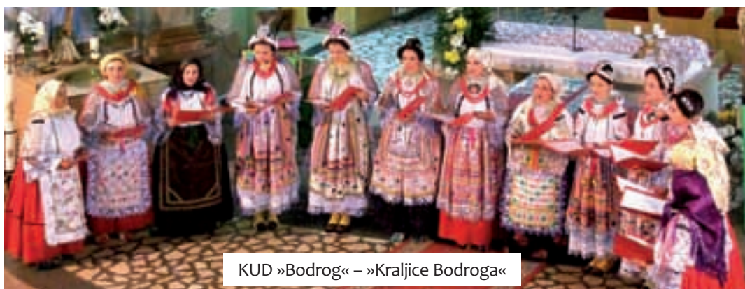
KUD »Bodrog« – »Kraljice Bodroga«

organizator ove manifestacije trudi se iz godine u godinu kroz različitu tematiku osigurati kvalitetan i interesantan program. Do sada su tema bile pjesme koje se pjevaju tijekom cijele godine, pjesme tijekom korizme, adventa... Ovogodišnji izbor teme je odista pružio širok spektar kompozicija, s obzirom da je Božić jedan od najznačajnijih kršćanskih blagdana, a veličinu Marijine uloge ne moramo ni naglašavati.