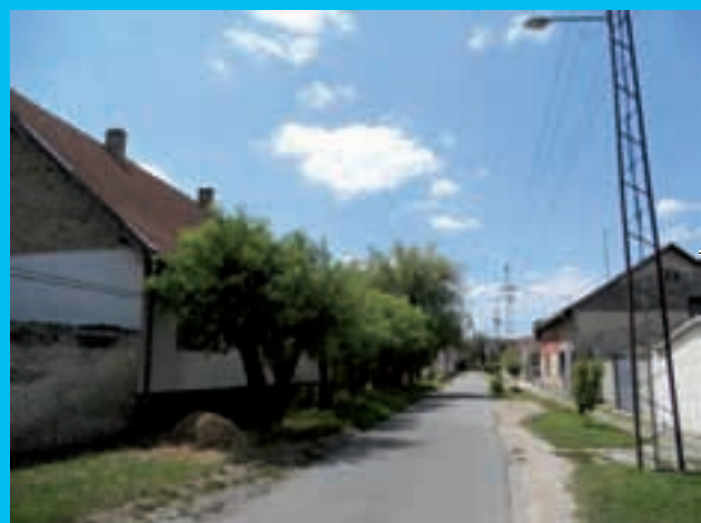
Vrbe u Travničkoj ulici, idealne za područja s visokom vodom