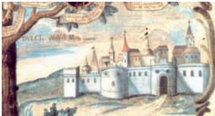
Ulazna kapija s istočne strane u srednjovjekovni Ilok

Dubrovački trgovci su stigli u Ugarsku Kraljevinu koncem XIII. stoljeća, po svemu sudeći ne preko Mačve, nego iz središnjih oblasti Raške, iz Rudnika gdje su trgovali metalima. »Dubrovčani su u Ugarsku dolazili na tri načina: (a) pomorsko-kopnenim putem, tj. brodom do Senja (ili Zadra), a zatim drumom preko Zagreba; (b) kopnenim putom preko Bosne i sjeverozapadne Srbije na Srijemsku Mitrovicu i Ilok; iz Braničeva i Smedereva na Kovin i dalje u Banat i Erdelj.« 1 Kopnom se putovalo karavanama, pa je Malo vijeće (neka vrsta »dubrovačke vlade«) biralo svaki put starješinu karavane – transporta, koji je nazivan kapetanom. Od Zvornika za Ilok, preko Srijemske Mitrovce postojao je karavanski put, koji se u Iloku