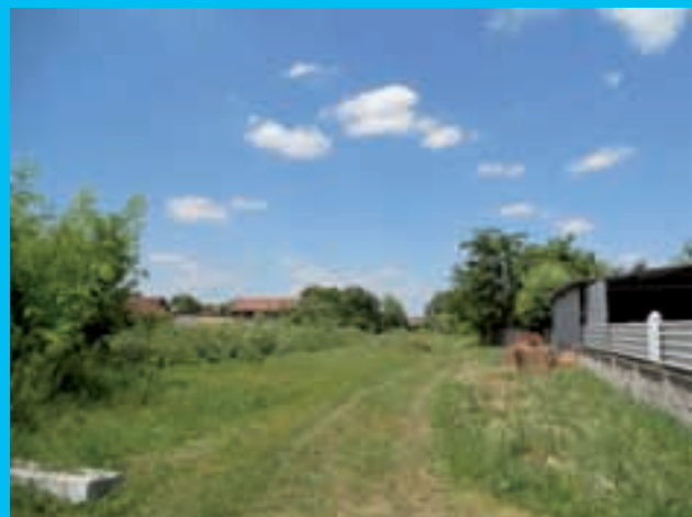
Prazan prostor nadomak grada pod prljavom vodom. Može li se ovdje napraviti idiličan zeleni kutak za djecu s gradskih ulica?