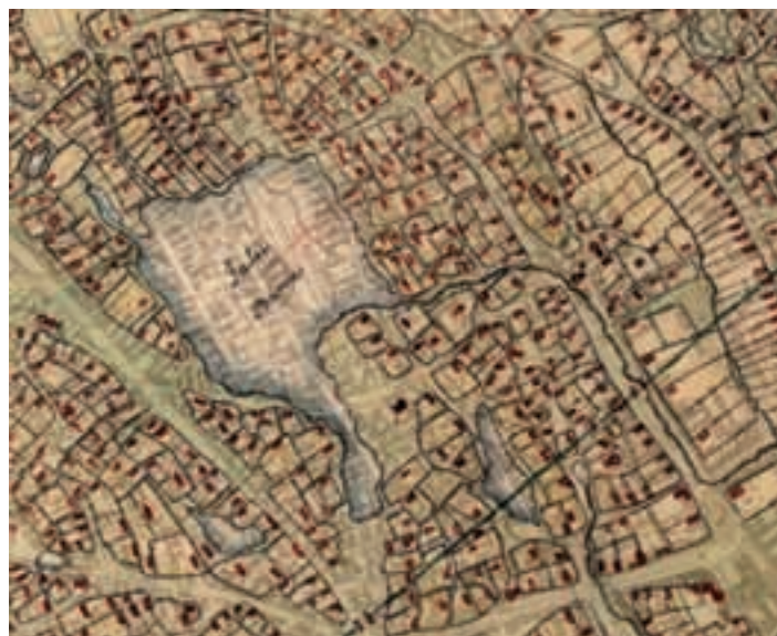
Jasibara u starim vremenima: lijevo Karađorđev put, desno Ulica Zrinjskog i Frankopana i Radijalac, u dnu karte Bajski put