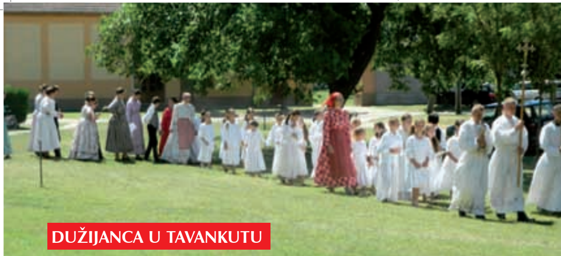
DUŽIJANCA U TAVANKUTU