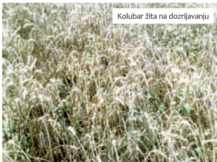
Kolubar žita na dozrijevanju