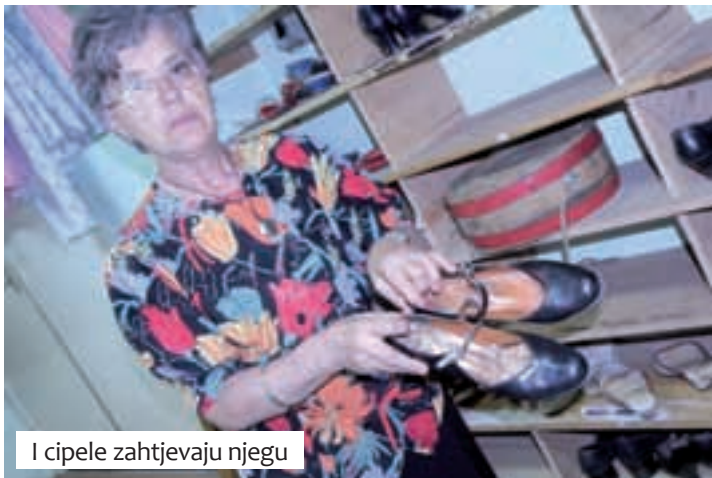
I cipele zahtjevaju njegu