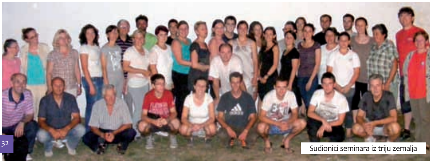
Sudionici seminara iz triju zemalja

Dvadeset sedam polaznika seminara došlo je iz Hrvatske, Mađarske i Vojvodine, a nekoliko je tavankutskih fokloraša i tamburaša, članova »Gupca«, također sudjelovalo i asistiralo na predavanjima i radionica-