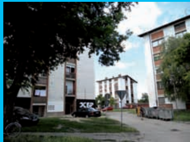
Naselje uz Prašku ulicu u kojoj se nalazio most. Na zgradi izvedenica iz toponima Jasibara