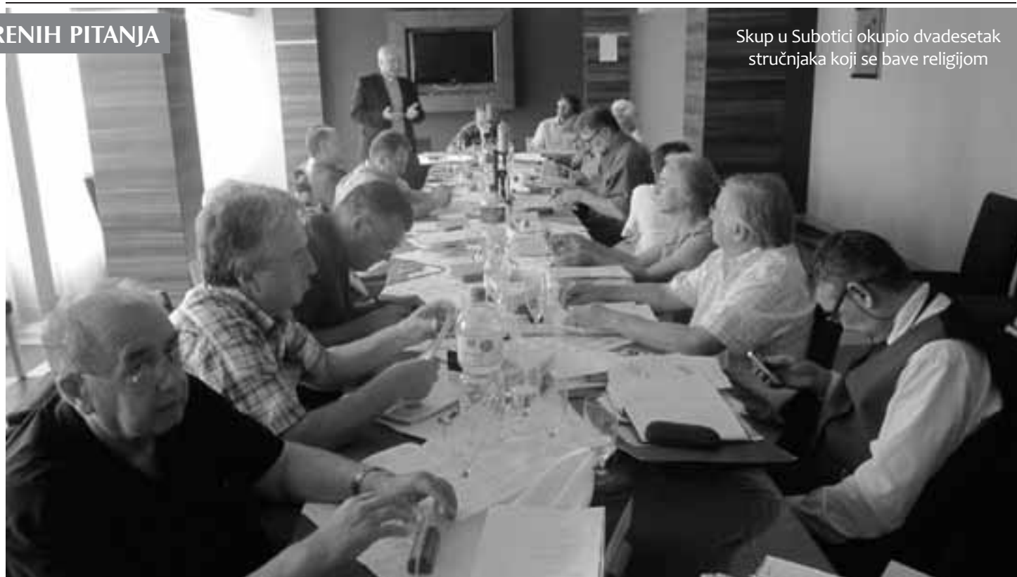
Skup u Subotici okupio dvadesetak stručnjaka koji se bave religijom

što će na to reći politika, odnosno državni vrh.» Sve dok kršćanstvo ne bude slobodna religija, mi molbe za oprost nećemo dočekati», smatra Markešić. Ističući da je »kršćanski kajati se«, dekan Evangeoskog teološkog fakulteta u Osijeku Peter Kuzmič rekao je kako niti molbom za oprost ne bi bila skinuta odgovornost s lidera navedenih vjerskih zajednica. Po njegovim riječima, zločine s početka devedesetih u Vukovaru mogli su spriječiti i svećenici i sveštenici i opatice i monahinje samo da su pozvali vjernike na pohod na zajedničku molitvu. Jedan takav čin, smatra Kuzmič, utišao bi topove i oružje s obje strane. Ali, to nijedna od njih nije učinila.