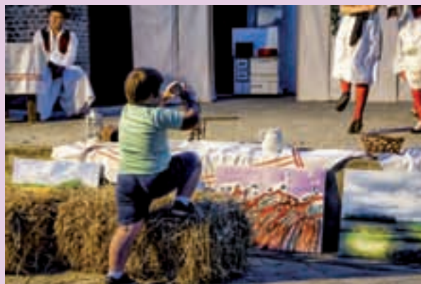
POZIVAMO ČITATELJE DA NAM POŠALJU NEKU SVOJU ZANIMLJIVU FOTOGRAFIJU

Mark Twain: Da bi spoznao pravu radost, moraš imati nekoga s kim ćeš je podijeliti.