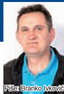
Piše: Branko Ivković

Faljen Isus čeljadi, jevo posli svi ovi naši lipi događaja sidi-mo prid dućanom i »ladimo« grla s po jednim pivom. Mora se čovik pokadgod malo i odmorit posli posla, a nama ode u ovoj našoj ravnici posla baš dao Bog, samo nam nije dao novaca, to je izgleda digod izgubijo buđelar pa ko veli: »Vi volite radit čeljadi, pa vas ne triba ni plaćat«, al šta nam je ondak dao ovu modu pa lektriku i sto uncutarija da se otkaleg okrenimo ono samo niki računi, di kojeg ne znam ni pročitat. Tribo je lipo ostat lampaš, i petrolin je bijo jedini trošak, al to je tako pa tako neg. Jel ste vi bili u Tavankutu na Dužijanci, ja bome jesam, baš je bila lipa, a tek uveče kolo, šteta što ja ne znam igrat, tako su lipo svirali tamburaši da sam se moro malo i opit. To je od žalosti što ne znam igrat, ja i u mojim svatovima nisam igro, samo su me trzali malo tamo malo vamo i gotovo.