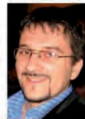
Piše: Marjan Antić urednik web-sajta

Zagreb, bijeli grad, nekada znan kao Gradec, što je ostalo kao ime za povijesnu jezgru grada koja se popularno naziva i Gornji grad, bio je i ostao prirodni centar Hrvatske. Danas je on svakako i turistički iznimno interesantna destinacija te kao takav privlači sve veći broj turista tijekom cijele godine, kako onih poslovnih, tako i klasičnih, sa city-break avanturama na umu.