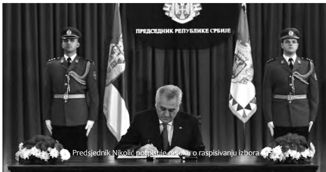
Predsjednik Nikolić potpisuje odluku o raspisivanju izbora

»Tajming koji je Tadić izabrao da sruši Đilasa je najgori mogući. Ta odluka je začuđujuća, jer je potpuno jasno da