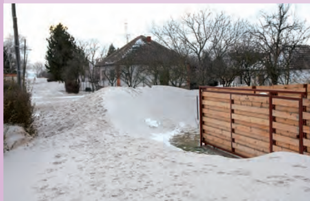
Zavijana ulica, a puta nigdje!

Konfucije: Nije mi žao što me ljudi ne poznaju, nego što ja njih ne poznajem.