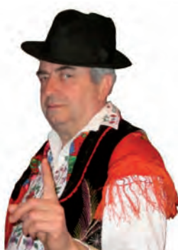
Piše: Ivan Andrašić

Pessoa: Vječni smo prolaznici pored nas samih.