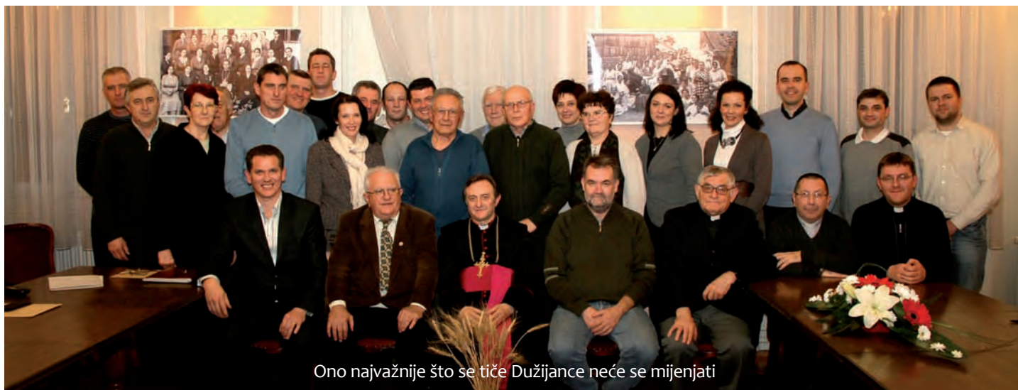
Ono najvažnije što se tiče Dužijance neće se mijenjati

kao predlagatelj te odluke, i HNV, koji je trebao predlagati imena Organizacijskog odbora Dužijance, nemaju namjeru organizirati neku posebnu Dužijancu.