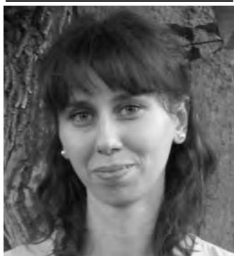
Piše: dipl. theol. Ana Hodak

I sus u svom govoru često koristi slike bliske svakodnevnom životu njegovih suvremenika. Ponekada su te slike u suvremenom svijetu teže razumljive zbog drugačijeg načina života, ali slike soli i svjetla u svim vremenima ostaju čovjeku bliske. Iz svih tih slika odzvanja jednostavna, vrlo konkretna i zahtjevna poruka.