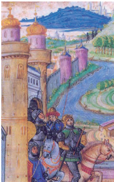
Oklopnik kralja Matijasa Korvina, ilustracija u kodeksu, XV. stoljeće

teritorij Srbije (tadašnjeg dijela Turskog Carstva) i pod komandom Pála Kinizsija ratnici su harali sve do Kruševca, a Kinizsi je preselio više tisuća srpskih seljaka na opustošeni južni teritorij. Kao povod za upad u Bosnu poslužio je pohod bosanskog paše, koji je u povratku iz Štajerske »onako usput« pljačkao Slavoniju. Hrvatsko-ugarsku »pravednu odmazdu« su vodili tadašnji slavonski ban László Egervári i srpski despot Vuk . Vojska je stigla opustošiti teritorij sve do Sarajeva. Najvjerojatnije su i oni doveli mnoštvo zarobljenika na pogranična područja. Poslije ovih čarki, ratova jedno vrijeme nije bilo, jer je Mehmed II. , zvani Osvajač, umro 1481. godine, a njegov nasljednik Bajazid II. bio je miroljubljiviji i 1483. godine s kraljem Matijasom sklopio je mir na pet godina, koji je poslije više puta obnavljan. Vjerojatno je ovaj čin izazvao papinu kritiku, ali mnogi smatraju da je Matijas Korvin postupio mudro, jer iako je bio među bogatijim vladarima Europe, turski sultan je bio daleko bogatiji i mogao je angažirati veći broj plaćenih vojnika nego hrvatsko-ugarski kralj. Matijas je uradio sve što je mogao, Pála Kinizsi je proglasio glavnim kapetanom »doljnjih krajeva« i on je vodio obranu granice između Slavonije i Erdelja, zatim je