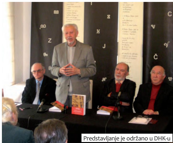
Predstavljanje je održano u DHK-u