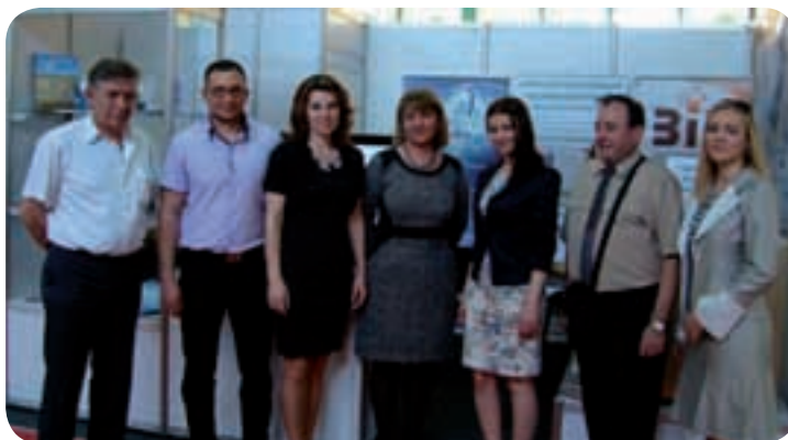
Subotičani na sajmu