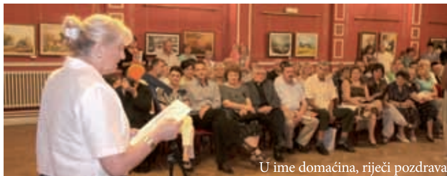
U ime domaćina, riječi pozdrava

Izložba slika nastalih na XVII. međunarodnoj likovnoj koloniji Bunarić 2013. otvorena je u četvrtak 31. srpnja u dvorani Hrvatskog kulturnog centra Bunjevačko kolo . Dvoranu krasi 39 slika, koje su zadovoljile zadani kriterij stručnog žirija. Po riječima voditeljice likovnog odjela HKC Bunjevačko kolo Nedeljke Šarčević , šest autora nije