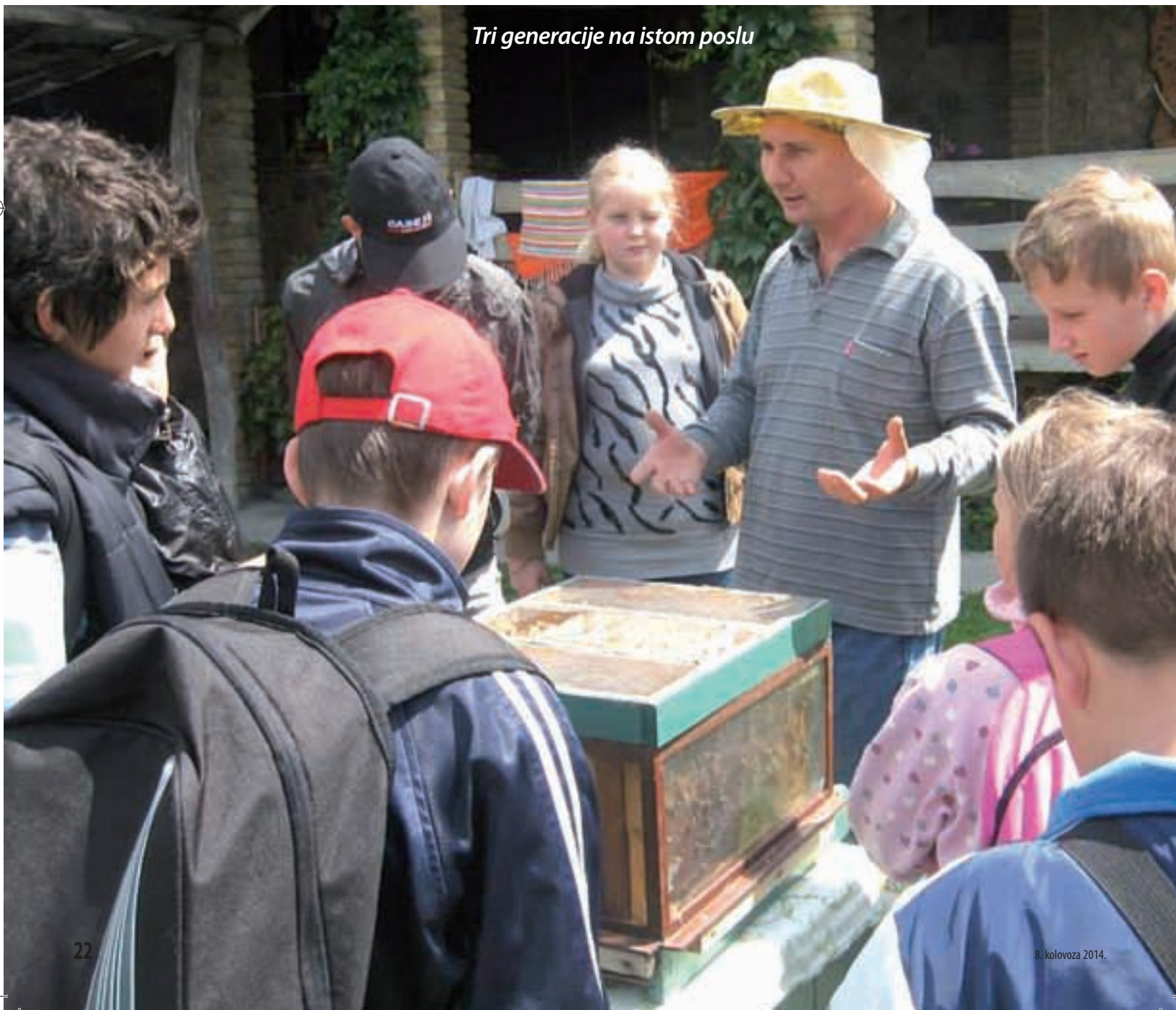
Tri generacije na istom poslu