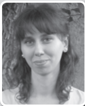
Piše: dipl. theol. Ana Hodak

N akon što je nahranio mnoštvo s dvije ribe i pet kruhova, kako smo čitali u Evanđelju prošle nedjelje, Isus ga otpušta sa željom da se povuče na osamu u molitvu, a svoje učenike šalje da se lađicom prebace na drugu stranu jezera (usp. Mt 14, 22-23). Učenici su poslušali Isusa ni ne sluteći da će se uskoro pred njihovim očima dogoditi još jedno čudo koje će prokušati njihovu vjeru.