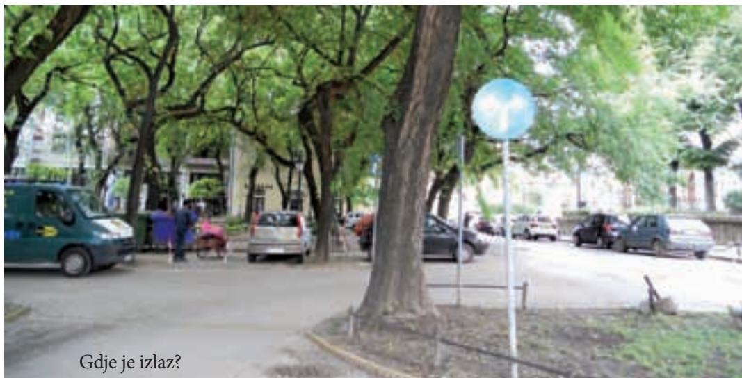
Gdje je izlaz?

ta velike vrijednosti za one koji su zahvaljujući toj gesti zaobišli rupu i potencijalnu opasnost za automobile i putnike u njima. Bila je to brižnost anonimnog »susjeda« za sigurnost drugih. Ako je svatko tko je tuda prošao zaobilazeći upozoravajuće šibljke na putu pomislio ili izgovorio »hvala«, nepoznati je čovjek bio »okupan« zahvalnošću. Što je malo vjerojatno, imajući u vidu kako danas riječ »hvala« ne pripada grupi često korištenih. Naspram ovog čina dobročinstva za opću sigurnost, stoji, naravno, čin-uzročnik i njegov vinovnik: onom tko je uzeo sigurnosnu rešetku s ceste radi osobne koristi (a šta bio drugo mogao biti