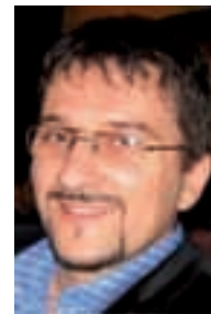
Piše: Marjan Antić urednik web-portala www.dobrodošli.net

Danas, jedino što nam ostaje jest da tim značajnim turističkim oruđem, fotoaparatom, bilježimo svoje pohode i užitke i skladištimo ih u naše moždane sive ćelije, kako bismo ih prizivali u sive jesenske dane, ili možda, kao mnogi entuzijasti na socijalnim internetskim mrežama, dijelili sa svima nesebično.