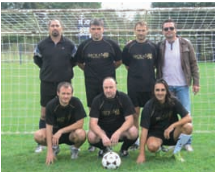
Generalni konzulat Republike Hrvatske