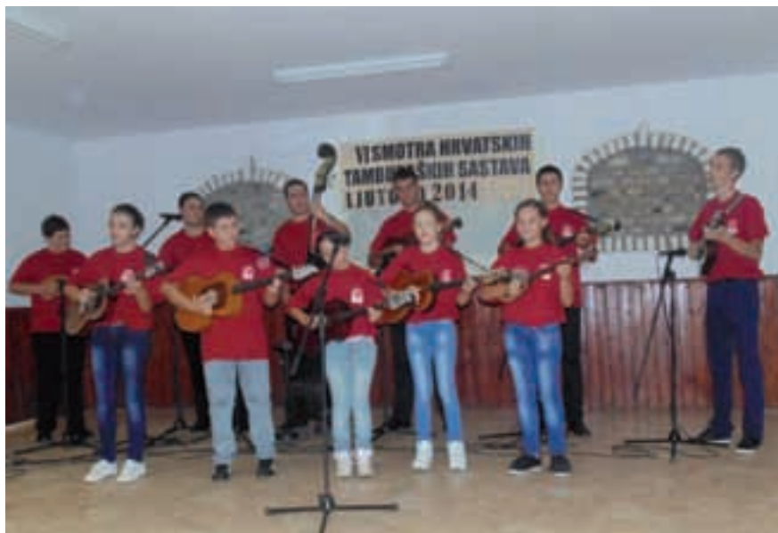
Mladi kao budućnost tamburaške glazbe

Zbog loših vremenski uvjeta smotra je, umjesto vani, održana u dvorani Doma kulture u Mirgešu, u kojem se okupio i veliki broj mještana. Nastupilo je pet tamburaških sastava: ŽTS Đurđinske cure iz Đurđina, HKC Srijem Hrvatski dom iz Srijemske