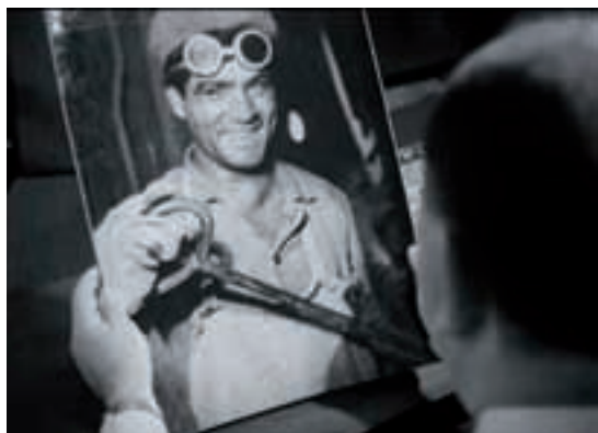
Devalvacija jednog osmijeha