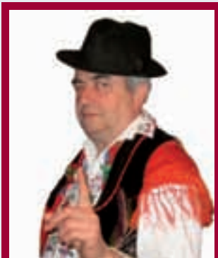
Piše: Ivan Andrašić

Bač Iva se oduvijek rado-vo izbiranju. Još u mladi dana od pokojnoga dađe naučijo da je to sveta dužnost. I danas se sića kako su se notaj dan dađa i mater znali lipo navuć, otit na misu, pa potli mise tamo di se izbiralo. A doma bi došli blaženi, ne zna jel brog pridike, jel brog izbiranja. Došo i on u godine ka se prvi put ide izbirat. Istina, dađa je već davno ukućanima reko koga bi tribalo izbirnit, tako je naučijo o njegovoga dađe. Politi-ka je oduvijek bila za gazdu kuće, šta se žene i dica razumu? U sebe