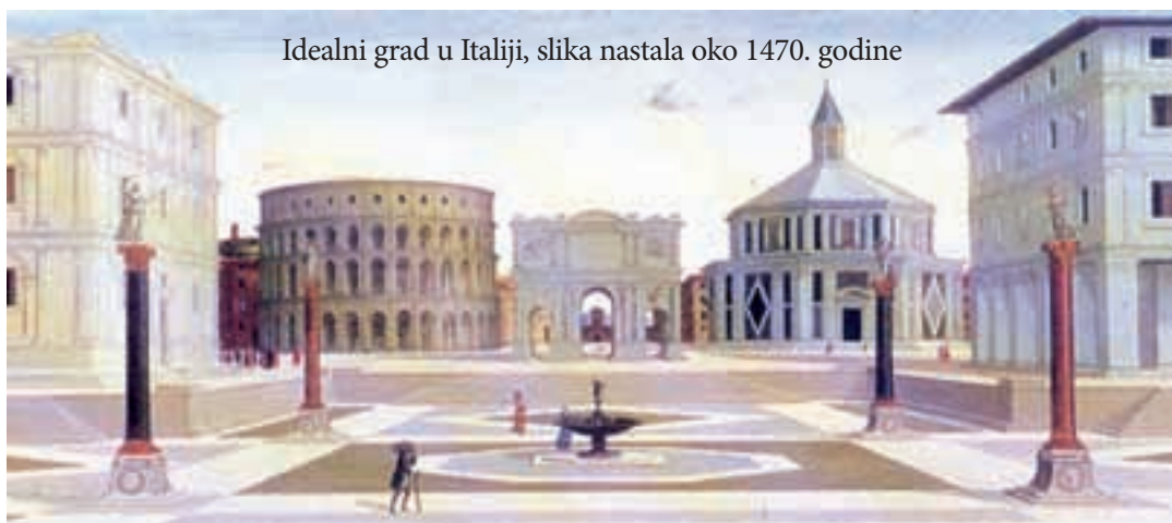
Idealni grad u Italiji, slika nastala oko 1470. godine

prostorima nagovještala budućnost njemačkih zemalja, ali i Europe. Tada smo još bili sudi-onici »europskih tendencija«. Antifeudalni rat u Njemačkoj je završen 1525. godine, Münzer je uhvaćen, zvijerski mučen i obezglavljen. Pod mukama je dao izjavu »omnia sunt communia« (sve je u zajednici ili zajednica je sve). Njegovi sljedbenici (zvali su ih i anabaptisti) su se rase-lili, i u gradu Münsteru 1534. godine osnovali »Novi Sion« po Münzerovim idejama, koji se zasnivao na zajedničkoj imovini, na »komunitetu«. Više od godinu dana su odolijevali napadima feudalne vojske, kada su pobijeđeni, skoro svi su pobijeni, a mrtvo tijelo jednog od vođa u krletki je obješeno na crkveni toranj, kao opomena ostalima. Malobrojni sljedbenici danas su dio protestantskih crkava i zovu se baptisti.