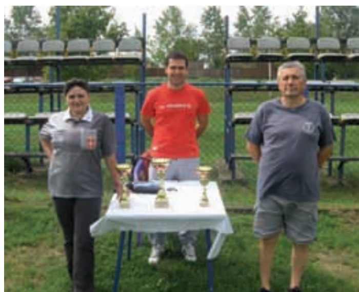
Pokali za najbolje