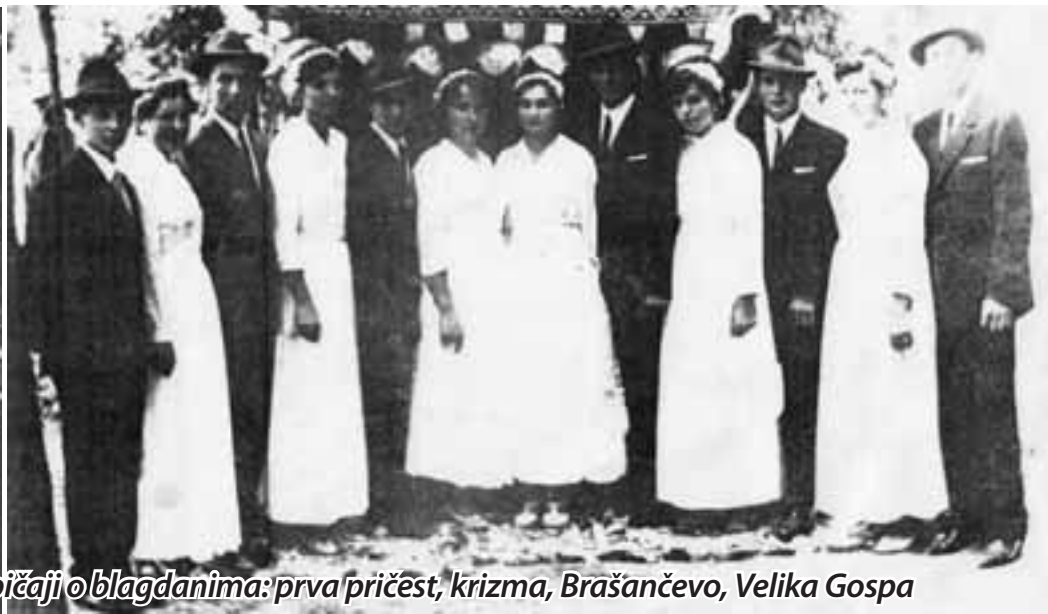
Crkveni obredi i običaji oblagdanima: prva pričest, krizma, Brašančevo, Velika Gospa