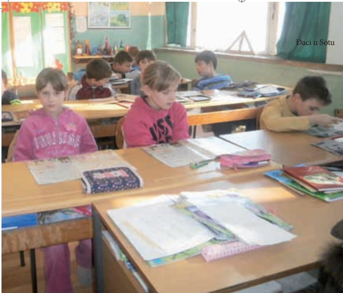
Daci u Sotu

ove školske godine u Plavni u prvom razredu nema čak niti jedan Hrvat. Ipak je i ove godine u Vajskoj prijavljeno 32 učenika, a u Plavni tridesdetero za izučavanje hrvatskog s elementima nacionalne kulture. Nastava će se u Plavni odvijati u tri skupine (šest sati tjedno). Osim hrvatskog u ovim školama se razmatra i mogućnost izučavanja mađarskog jezika, za što također postoji interes.