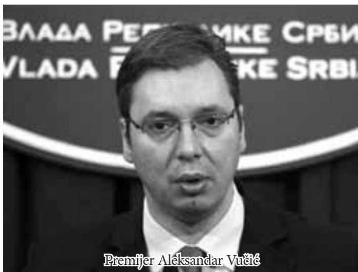
Premijer Aleksandar Vučić

Proračunski deficit je u prvom kvartalu ispod tri posto BDP-a, što predstavlja veliki uspjeh, kaže premijer Vučić * Stvarno zaduženje Srbije u prva tri mjeseca poraslo za 55 milijardi dinara, od čega je 21,1 milijarda korištena za pokrivanje deficita, a ostatak za povećanje likvidnosti, kaže ministar Vujović