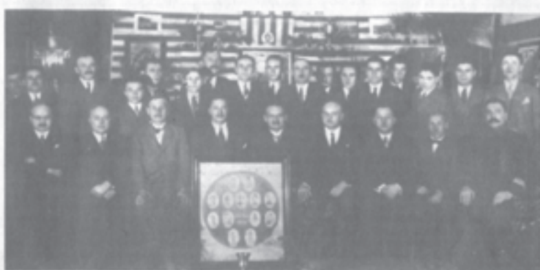
Управа ФК Бацка 1931. године

У својој породици арђа према ФК Бацка преноси се с колена на колело, сви смо били играчи, па и ја као дечак и младић. О времену оснивања клуба, о животу у некадашњој Суботици, када је она с почетка века имала више становника него Београд, и 1300 улaчних свaтилjки, или 91 километар улaца, слушао сам у кругу порoдичне