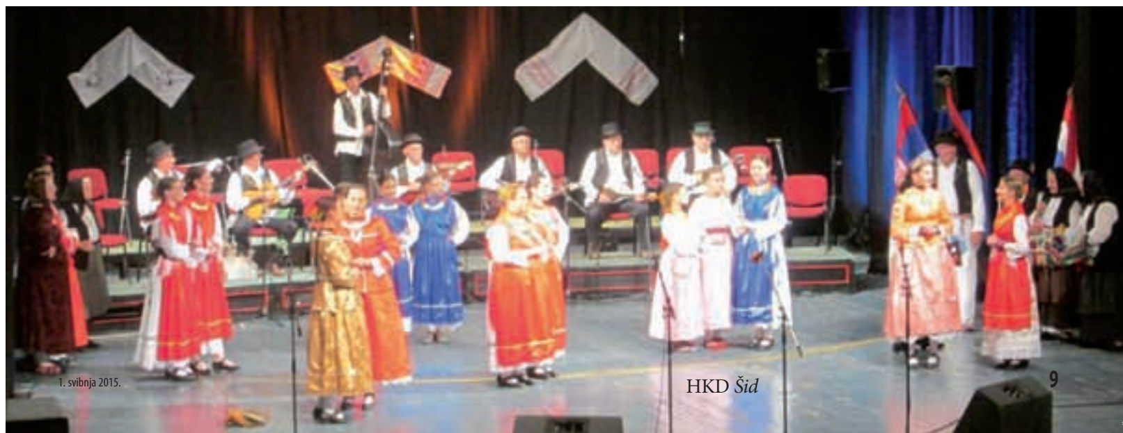
1. svibnja 2015.