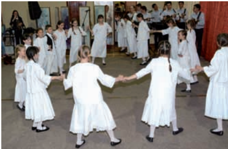
Najmlađi u igri