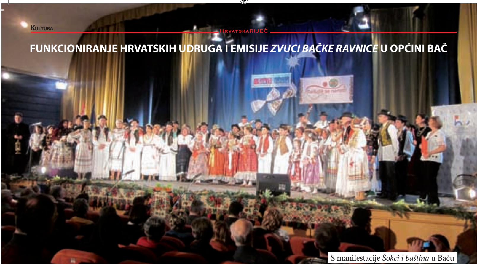
S manifestacije Šokci i baština u Baču