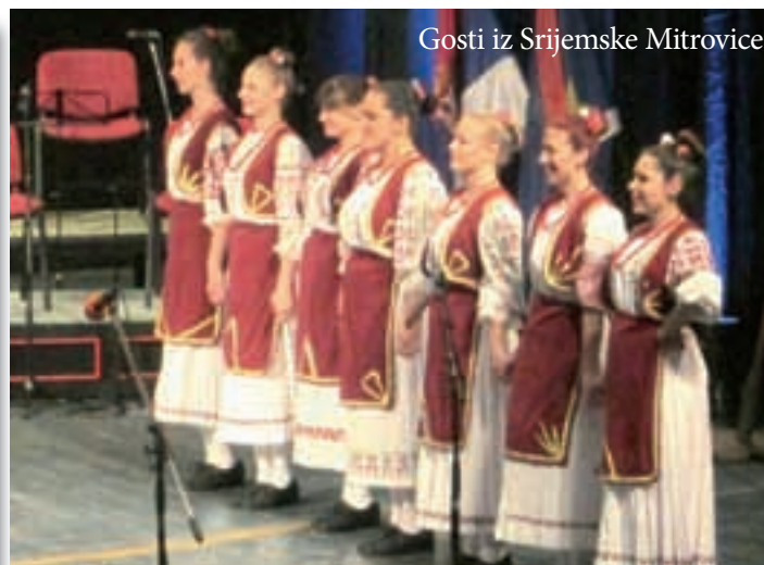
Gosti iz Srijemske Mitrovice

mora odraditi svoj dio zadatka, kako Veleposlanstvo Republike Hrvatske, tako i Hrvatsko nacionalno vijeće, a tako i hrvatske udruge. To je jedno tijelo