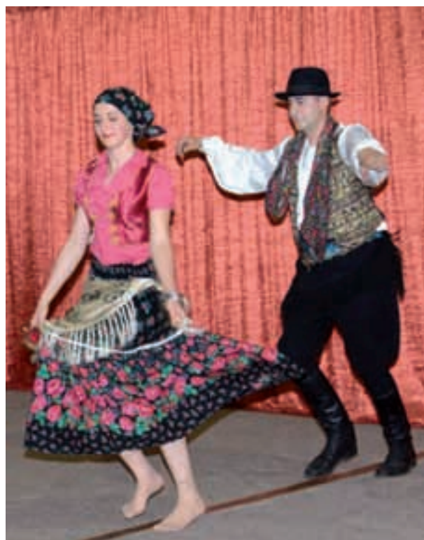
Romski parovni ples