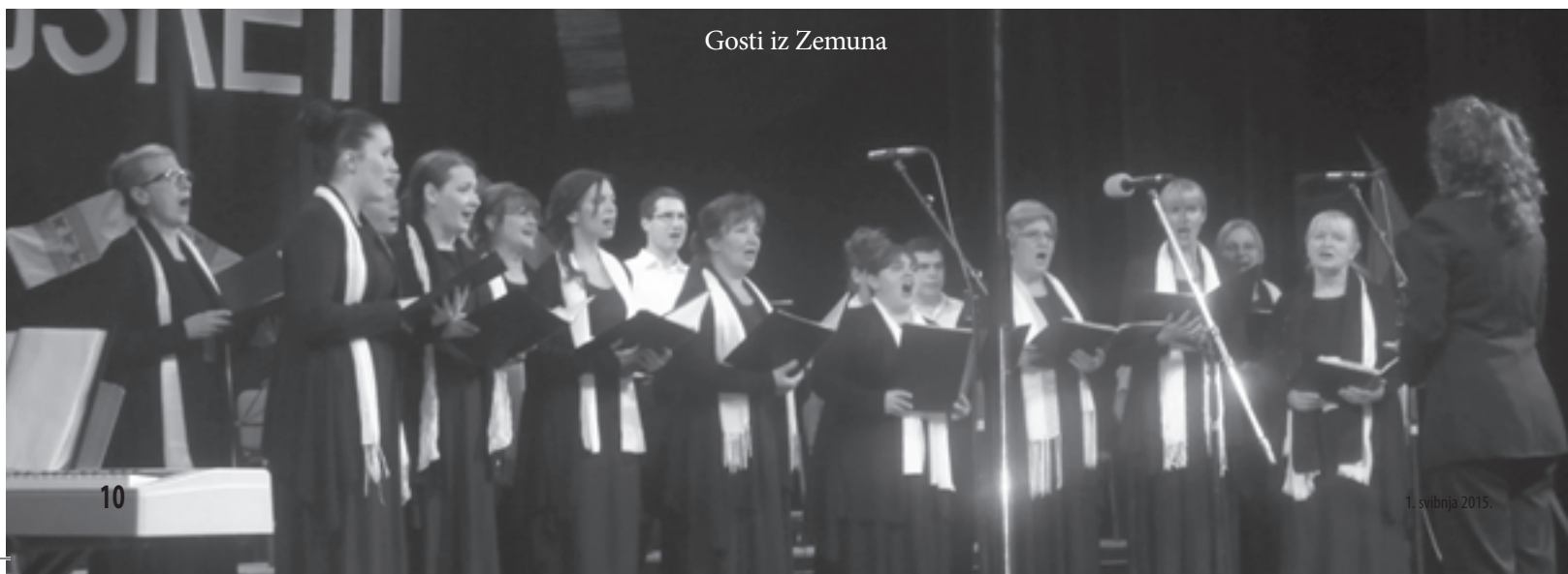
Gosti iz Zemuna