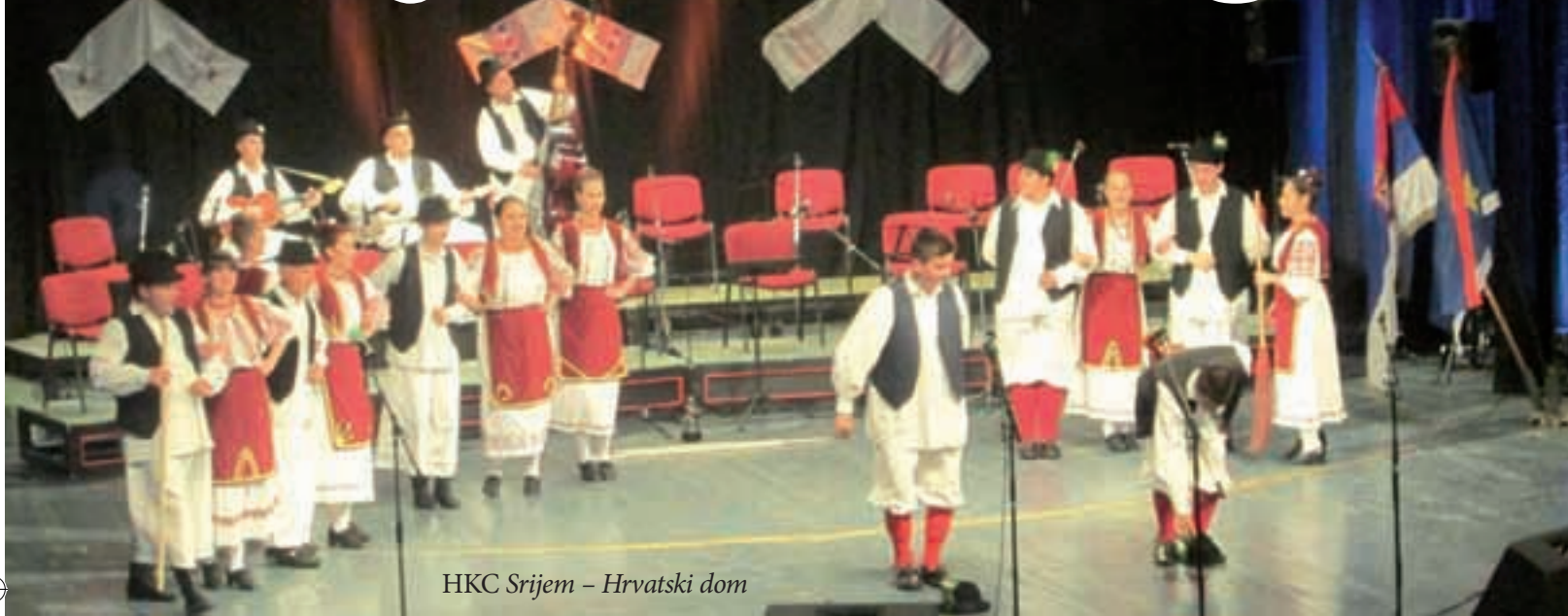
HKC Srijem – Hrvatski dom

Ove godine na manifestaciji Srijemci Srijemu u Rumi predstavili su se članovi osam hrvatskih kulturnih udruga iz Srijema i gostujući folklorni ogranak HKC Bunjevačko kolo iz Žednika. Manifestacija je otvorena nastu-