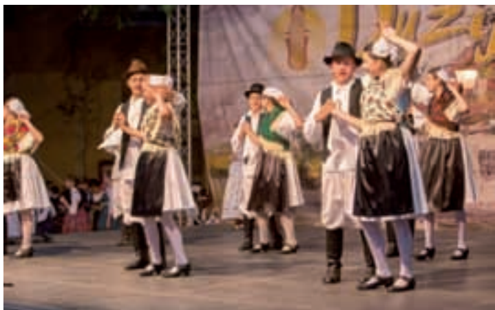
KUD Rokoko , Čikreja