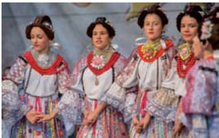
KUDH Bodrog , Monoštor