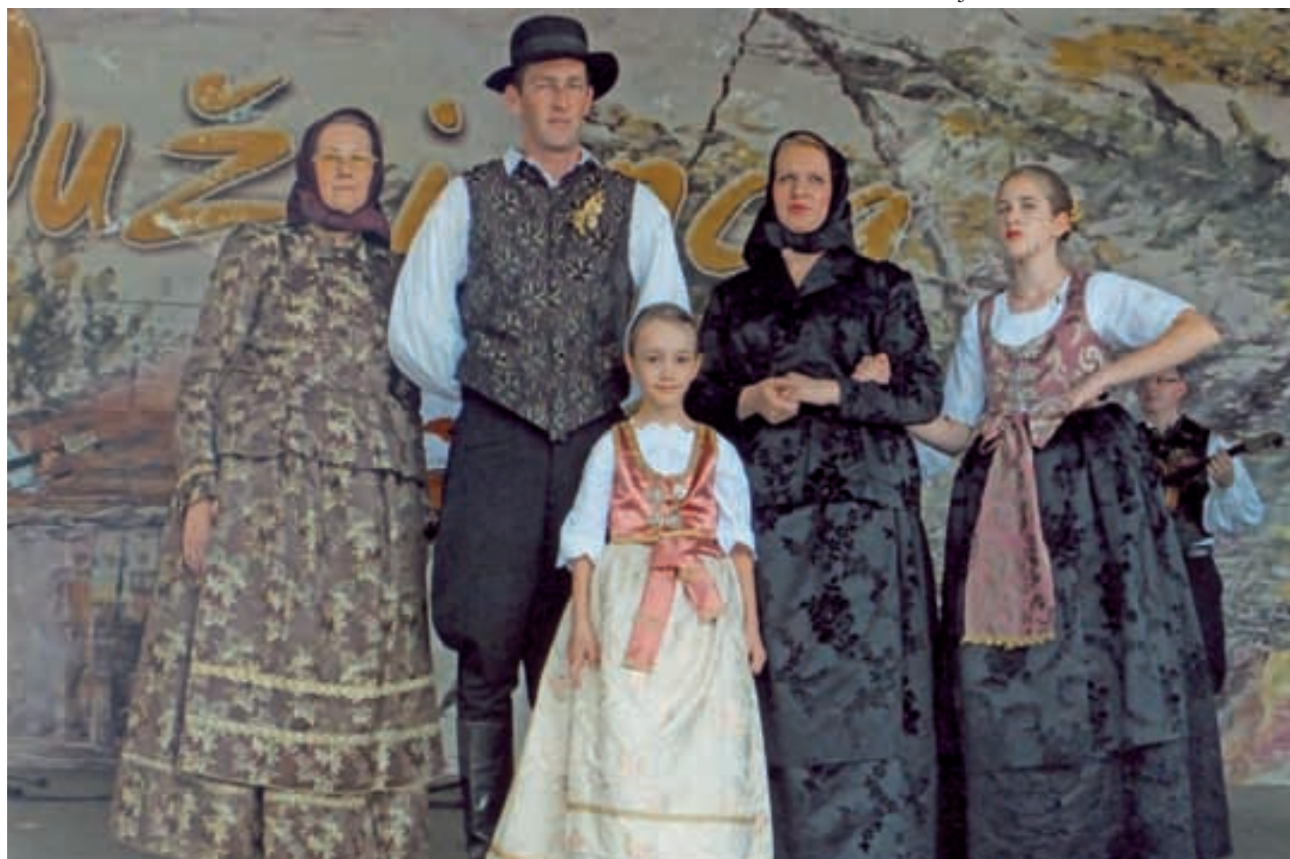
Obitelj Šimić na pozornici Dužijance