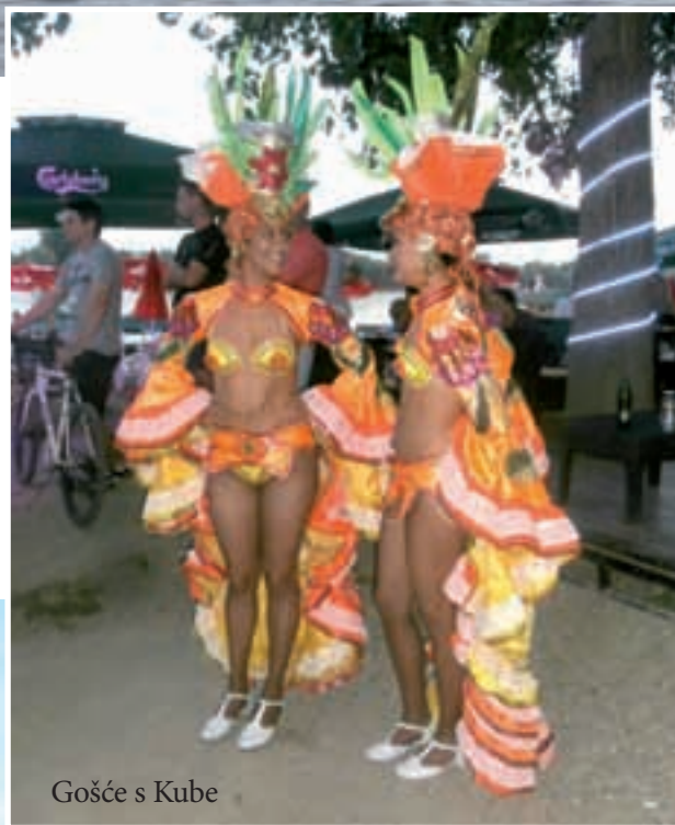
Gošće s Kube

Nakon regate, na prepunoj gradskoj plaži u Mitrovici, Mitrovačane je zabavljao kubanski bend Cubalcanika , koji je bio