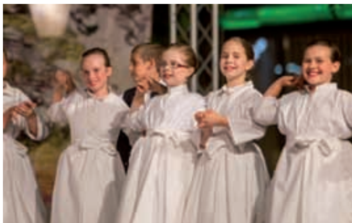
HKC Bunjevačko kolo , Subotica