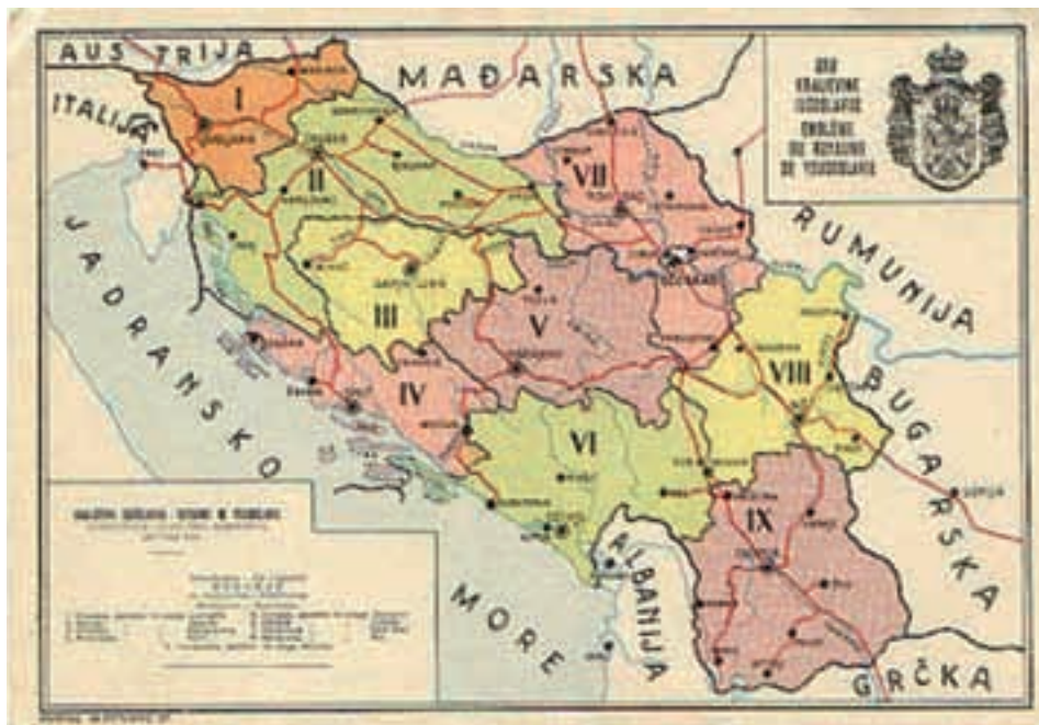
Podjela Kraljevine Jugoslavije na banovine

Poslije ovog malog »intermezza« da se vratimo osnovnoj temi, regionalizmu i regionalizaciji. Rječnik stranih izraza ovako definira pojmove: regionalizam (sociologija) – nastojanje, težnja da se razvije ekonomija, politika i kultura jedne regije; a regionalizacija (lat. regionalismus ) znači – organiziranje države po regijama, regionalizirati – urediti državu po regijama uz poštovanje i uvažavanje njihovih specifičnih osobina. Često se ovaj pojam spominje i kao decentralizacija (centralno) uređene države. Suprotno ovom pojmu je: metropolizacija koncepcija državne uprave, ekonomije, kulture u glavnom gradu (spominje se i kao centralizacija). Bivša nam se država kretala od stroge centralizacije prema decentralizaciji. Onda su sve stečevine decentralizacije nasilno ukinute ( Jogurt revolucija ), pa je nešto vraćeno, ali zapravo naša sadašnja država pomalo »ne zna« kakvo buduće uređenje želi. Zasad su