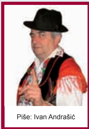
Piše: Ivan Andrašić

Kako došlo vrime žetve, u selu zaredo lopovšag. Zaredali i vi što se deru sokakom, jedni kupuju novo perje i staro gvožđe, drugi prodaju košareve i vankuše. Otvoru vraca, pa oma u dvor. Zoto bać Iva i volji ostavit Taksu odvezanoga. Štodira da nuz njega nabavi i kakoga malo većega i bisnijega kera. A ope, ne zna, rastolmačijo mu jedan žandar da će jako odgovarat ako kogagod ugrize, pa makar to bilo u njegovomu rođenomu dvoru. Oma mu je pito a šta bi taj i radijo u njegovomu dvoru,