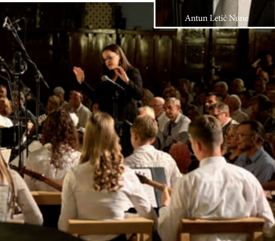
Subotički tamburaški orkestar