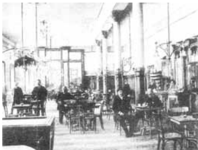
Kavana u hotelskom krilu zgrade kazališta