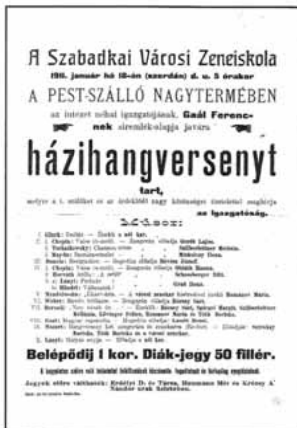
1. városi zeneiskola koncertplakátja 1911-ből

Ova se dvojnost, tijekom vijekova, mijenjala sukladno usložnjavanju uljudbenih sazrijevanja, shvaćanja i izmjena unutar aktualnih kulturnih obrazaca, primjerice u crkvenoliturgijskom pjevanju i muziciranju, pri čemu se glazba, uz ostalo, svakako dala razlikovati i prema žanrovima. Od onih iz puka poteklih, popularnih, mahom rekreativnih (samo) niklih stilova iz plesnjaka, do navlastitih vrijednosti koncertnog, scenskog izvođenja zvučnih produkata tzv. visoke kulture, primjerice popularnih napjeva i arija, nerijetko znanih i omiljenih samo a capella , premda uzetih iz opereta i opera; nadalje, iz različitih formi glazbeno utjelovljenog kazališta, ako se razmatra značaj muzike, primjerice za baletnu scenu, kada ona već u samoj izvedbi ima osebujnu vanjštinu, gdje kada fascinantly različitu u pojedinim kulturama ili njihovim miljeima. Kada zadobiva posve drukčiju formu, ovisno i o izvedbi što na svoj način može pridonijeti njezinom socijalno-promidžbenom aspektu, kada se nerijetko publika naglašeno veseli i pleše, a tako i u umjetničkom iskazu koji na današnjem stupnju razvoja glazbene umjetnosti može utjecati upravo na kvalitetu – nje same –