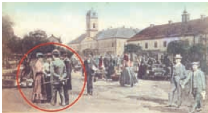
Stara gradska kuća i pijačni trg

nice inspirirane ovim saznanjima. Tako na jednoj razglednici vidimo crtež buduće Gradske kuće i Kazalište, a iznad njih leti jedno policijsko vozilo; vidimo i lebdeću gostionu Venus u obliku bureta, jedan veliki zepelin, zatim leteće pojedince, a na zemlji mnoštvo biciklista,