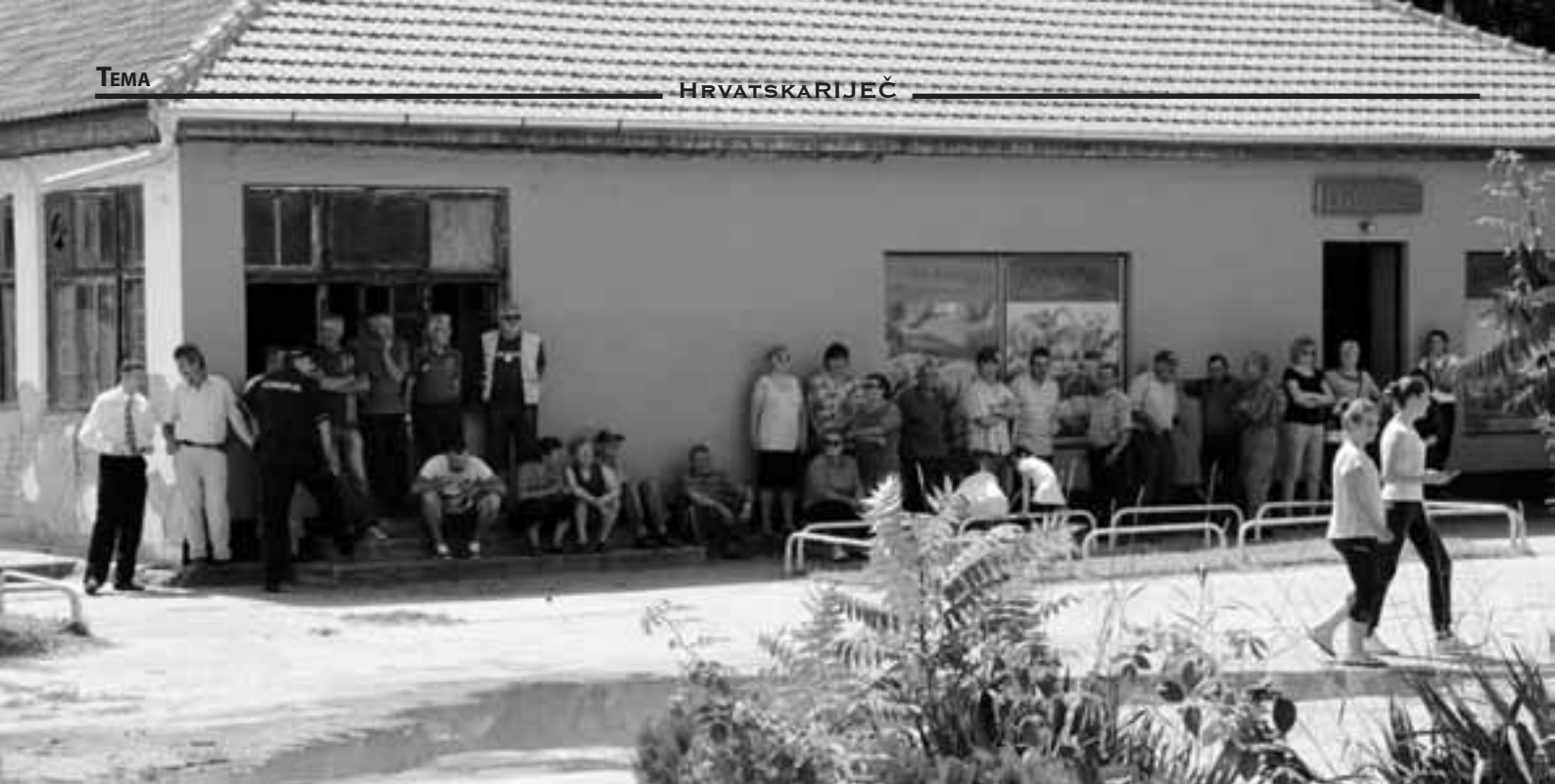
Tavankučani u iščekivanju obećanja

Tavankuta zapravo refleksija političkih snaga i odnosa u lokalnom parlamentu. Međutim, za razliku od svojih prethodnika, Merković vjeruje da će obećanja biti ispunjena, a kao pokriće za to navodi riječi republičkih i pokrajinskih zastupnika da postoji ozbiljna namjera da se drugačije pristupi rješavanju problema, ne samo u Tavankutu, nego općenito – i u Vojvodini i u Srbiji. U prilog tomu on navodi i vlastiti osjećaj da nakon susreta Kolinde Grabar – Kitarović i Aleksandra Vučića »postoji ozbiljna spremnost da se na tim stvarima poradi«, iako je, kako kaže, to