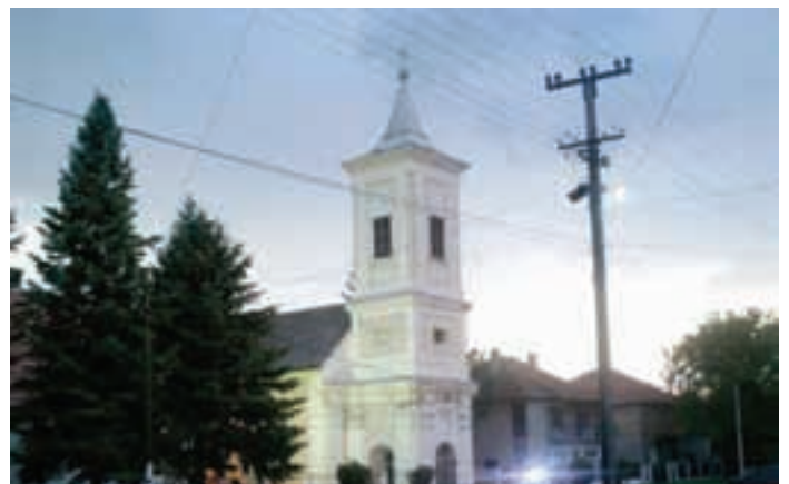
crkva Rođenja Blažene Djevice Marije