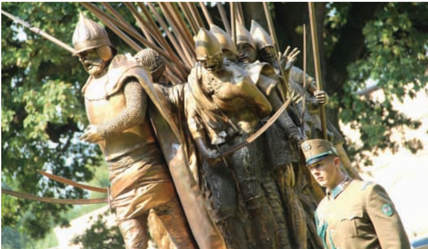
Nikola Šubić Zrinski s vojskom

Nikola Šubić Zrinski svojim je vodstvom i hrabrom obranom u bitci kod Sigeta protiv Osmanskog carstva »spasio civilizaciju«, današnju zapadnu Europu