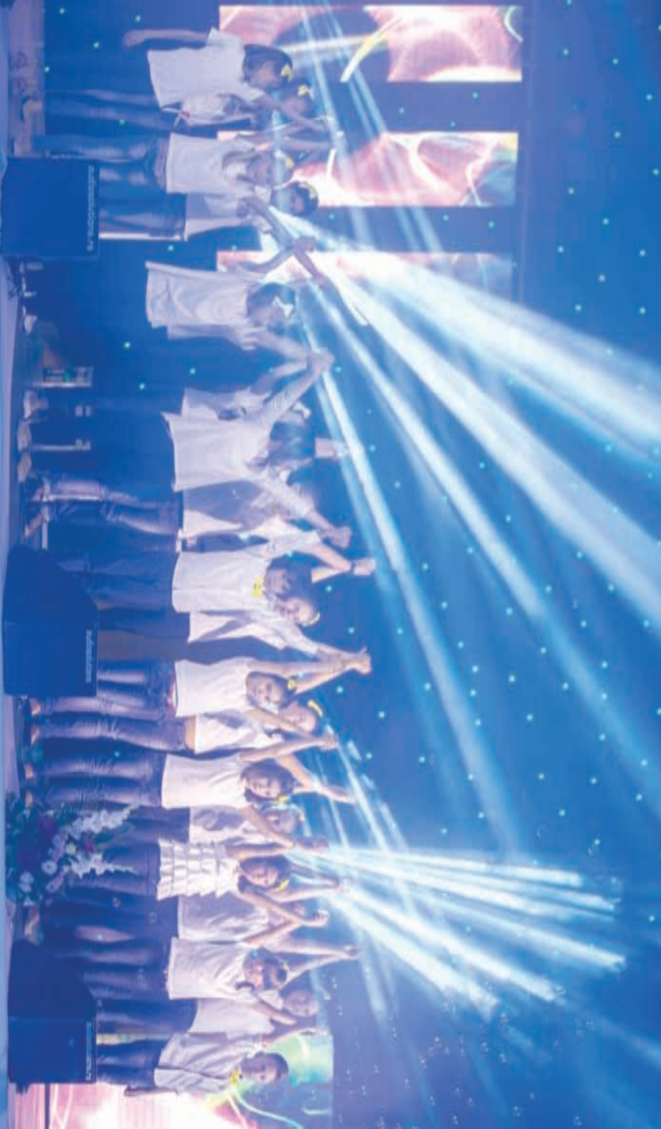
Djeca na HosanaFestu 2016.