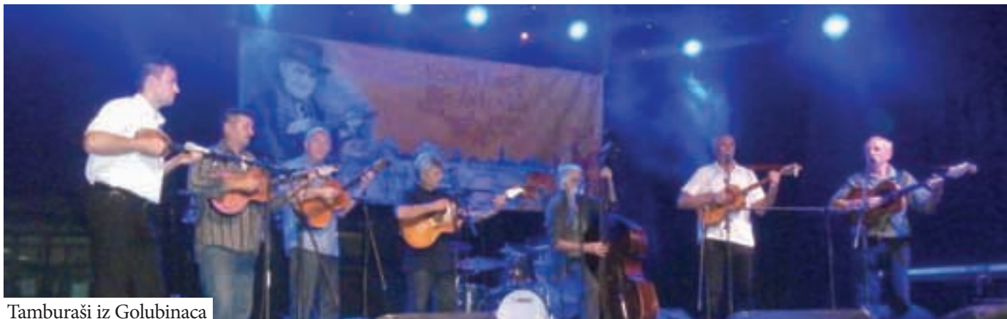
Tamburaši iz Golubinaca