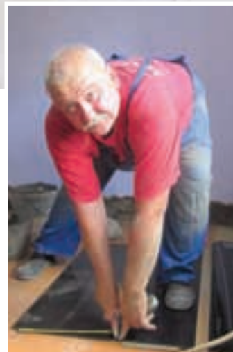
Antun kroji izolacijski materijal

»Vlaga u zidovima, ili kaplarna vlaga, najčešći je uzrok propadanja starih kuća i objekata, osobito ukoliko su u pitanju nabijače. Iz iskustva znam da većina njih ima i temelje od nabijene zemlje, bez ikakve izolacije, pa se u mnogima do danas vlaga popela do stropa. Isti problem javlja se i u kućama novije grad-