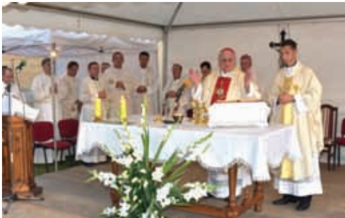
Mons. Đuro Gašparović predslavio je misu

ki broj vjernika. Ovo je veliki jubilej i za ovu crkvu i za ovo mjesto, u kojoj danas živi manji broj vjernika nego što je bilo prije. No, unatoč tome ovo je veliki dan za njih i ovu crkvu koja ustrajno stoji ovdje unatoč pokušaju miniranja i svih nedaća koje je imala. Mi živimo u miru sa svim ljudima drugih vjeroispovijesti i sigurno je da