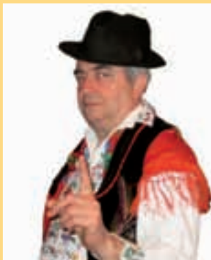
Piše: Ivan Andrašić