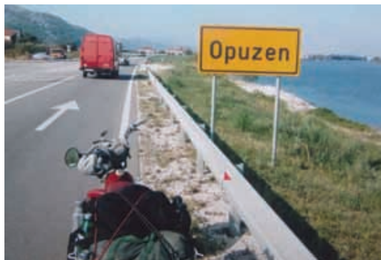
Tomos u Opuzenu

Tomosom uputio u Međugorje, ali kaže da mu je ovo bio i najduži i natježi put.