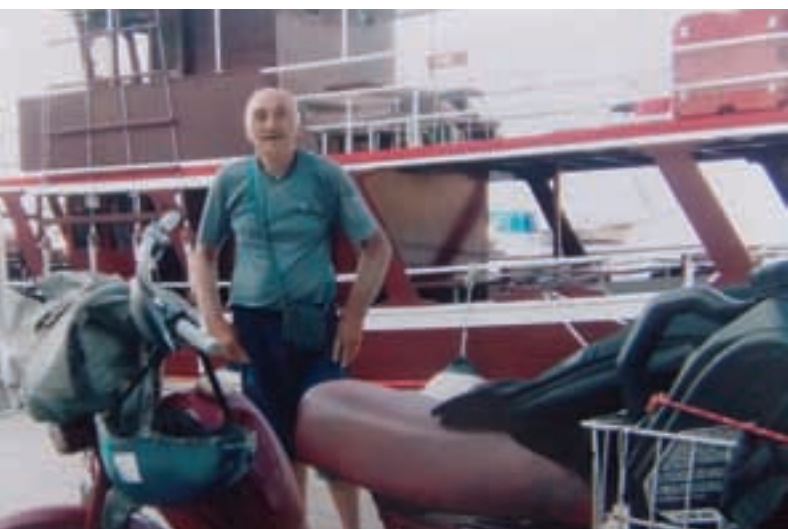
Tomos i Blago u Omišu