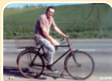
Piše: Branko Ivković

Baš taman i na vrime, doduše nisam skroz zgotovijo, al mož se asni-rat. Sasvim sam zado-voljan što mi tako ispo čardak. Opravijo sam ga, veli moj komšo Periša, da nemož bolje. No, samo me fali... Ta di ne mož bolje kad mu već po vika, stari i dotrajo, na sve