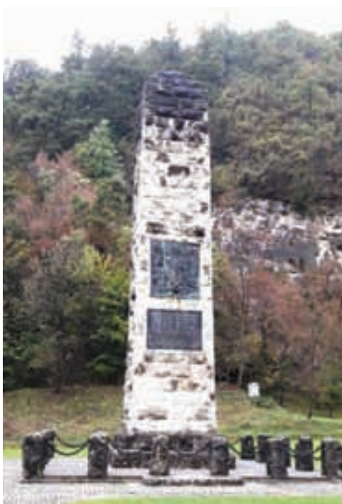
Spomenik hrvatskoj himni

Iznimnom uspjehu predstavljanja HKPD-a Jelačić i dijela glazbenog naslijeđa hrvatske zajednice u Petrovaradinu pridonijeli su, također, i atraktivni repertoar dalmatinskih klapskih pjesama poput Vilo moja , Cesarica , Ružo crvena i dr.