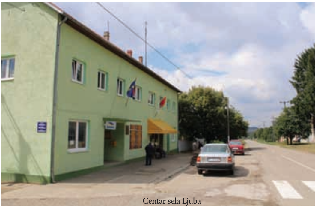
Centar sela Ljuba

Prema popisu stanovništva iz 2011. godine u Ljubi je živjelo 446 stanovnika. Danas je taj broj znatno manji. Većinsko stanovništvo čine Slovaci oko 53 posto, Hrvati 23 i Srbi 17 posto. Prosjek godina ljudi u selu je 55, a ima ih dosta koji se nisu odlučili na brak, tako da nemaju ni svoje potomstvo. Kako navode mještani, suživot je dobar, svi se lijepo slažu, družu i poštuju a u Domu kulture često se održavaju kulturne manifestacije koje organiziraju slovačko i hrvatsko kulturno društvo koja aktivno djeluju u selu. Ali, kako kažu, sve bi bilo puno lakše kada bi imali samo malo bolje uvjete za život: »Samodoprinos u selu ukinut je u prosincu prošle godine i poslije toga nije izglasan. Mnogo bolje stanje je bilo prije rata, kada je privreda cvjetala, zadruge radile, financijski su bolje stajale i bio je siguran otkup. Sada su se zadruge ugasile, a zemljište je pripalo državi. U selo se dugo ništa nije investiralo, a ono što bi nam svakako značilo to je konačna izgradnja vodovoda. Međutim, to je projekt vrijedan 40 mili-