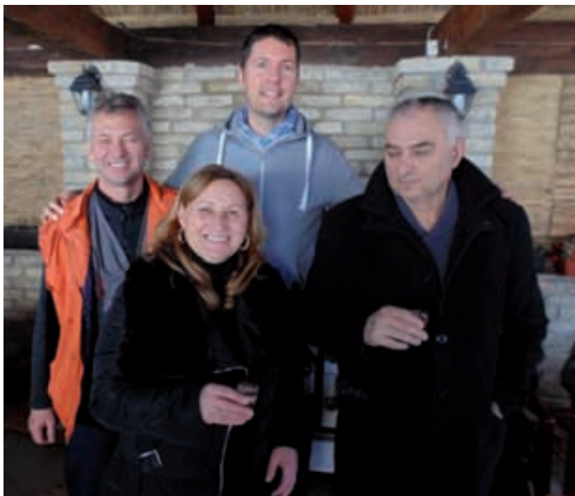
27. siječnja 2017.