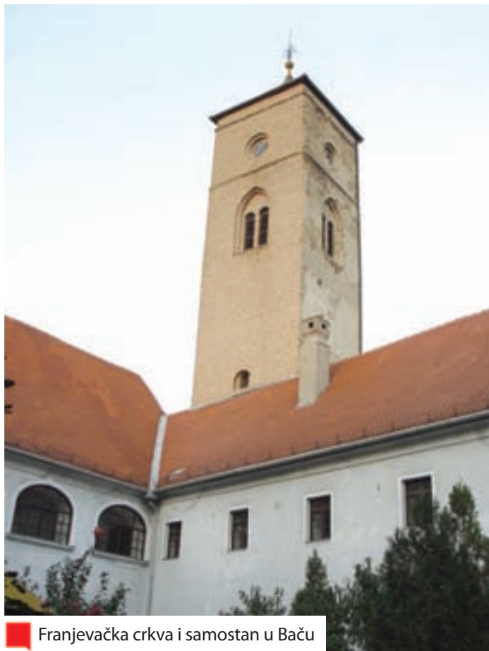
Franjevačka crkva i samostan u Baču

Šokci) doselili u Bačku. Dio disertacije objavio je poslije kao knjigu. Subotičke novine od 28. srpnja 1939. osvrnule su se pohvalno na ovaj Bukinčev uspjeh: