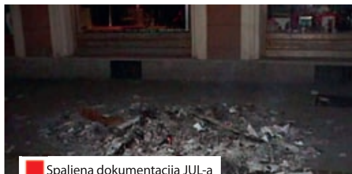
Spaljena dokumentacija JUL-a

1779. godine. Promijenjen je i grb grada. Tada u gradu oporbeni stranka SPS je burno, ali bez uspjeha prosvjedovala protiv ovih promjena. Ono što se promijenilo nagore bio je propast industrije iz raznih razloga. Među prvim je propao Integral , zatim 29. novembar . Kod obje radne organizacije propasti je pridonijelo i to da je nekad sigurni platiša JNA imao veće brige od plaćanja svojih dugova. Reprivatizacija koja je vršena pod sumnjivim