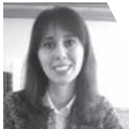
Piše: dipl. theol. Ana Hodak

13. lipnja – sv. Antun Padovanski 19. lipnja – Presveto Srce Isusovo 20. lipnja – Srce Marijino 24. lipnja – Rođenje Ivana Krstitelja 29. lipnja – Petar i Pavao 30. lipnja – Rimski prvomučenici