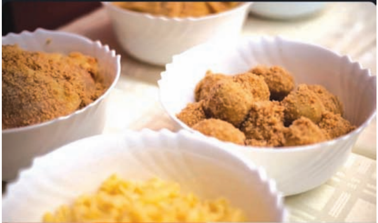
Gastrofest u Subotici